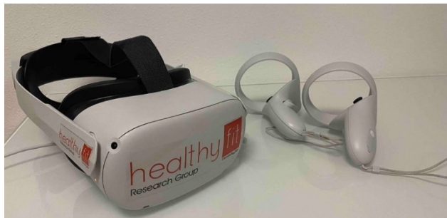
Figura 1. Hardware usado en la intervención: Meta Quest 2.

Meta Quest 2 ( www.meta.com accessed on 12 de Julio 2023), compuesto por un HMD portátil y dos controladores (Figura 1).