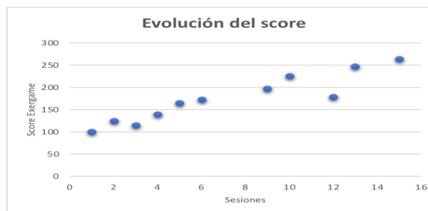
Figura 3. Evolución del score en el exergame a lo largo de las sesiones

* En la semana 31/7 - 6/8 solo se realizó una sesión por estar de vacaciones.