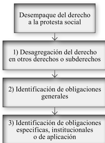
Ilustración 2. Metodología de investigación para aplicar el desempaque del derecho a la protesta social

Un primer momento de la investigación correspondió a la búsqueda y selección de fuentes de información en el SIDH sobre el derecho a la protesta social. En este apartado fue clave identificar tratados y convenios regionales, jurisprudencia y relatoría de la Corte y Comisión Interamericanas que abordasen directa o indirectamente la temática en cuestión. Así mismo, se tuvo en cuenta que estas fuentes de información fuesen relevantes y pertinentes para el desarrollo del problema jurídico planteado. Posterior a la selección de instrumentos del SIDH sobre la temática por estudiar, se dio paso a la lectura y análisis de las fuentes de información seleccionadas (segundo momento de investigación). Seguido a lo anterior, correspondió la realización en sentido estricto del desempaque del derecho a la protesta social, cuyo subproceso se realizó de la siguiente manera: