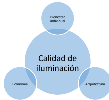
Figura.1 Calidad de la iluminación: la integración del bienestar individual, la arquitectura y la economía