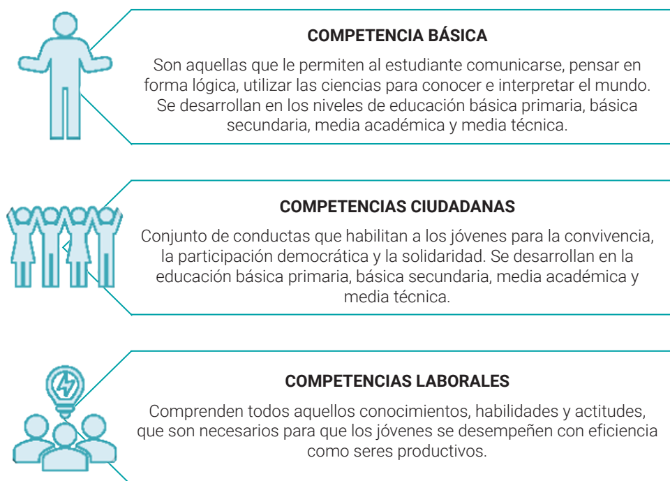
Figura 2. Competencias de educación

Competencias generales de educación. Las competencias a nivel académico se encuentran asociadas a las condiciones de aprendizaje que están definidas por el MEN (2008), que, a su vez, se encuentra articulado con el sector productivo; por ello, el sistema de educación estableció tres competencias: básicas, ciudadanas y laborales. En la siguiente figura se ilustra la clasificación de las competencias generales en la educación.