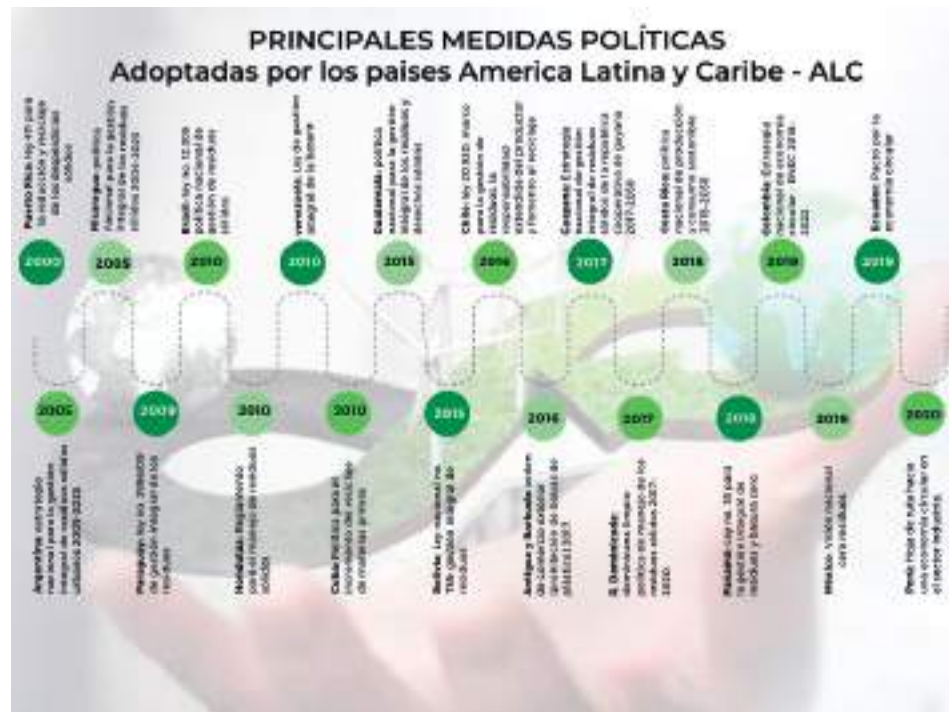
Figura 1. Principales medidas políticas adaptadas por los países de América Latina y Caribe (ALC)

Nota: adaptado del documento de investigación La economía circular en América Latina y el Caribe .