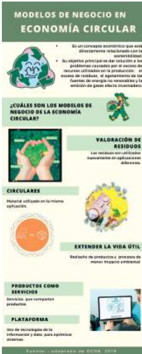
Figura 2. Modelos de negocio en economía circular

Nota: adaptado de OCDE 2019.