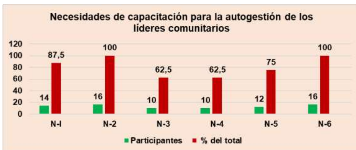
Gráfico No.11.