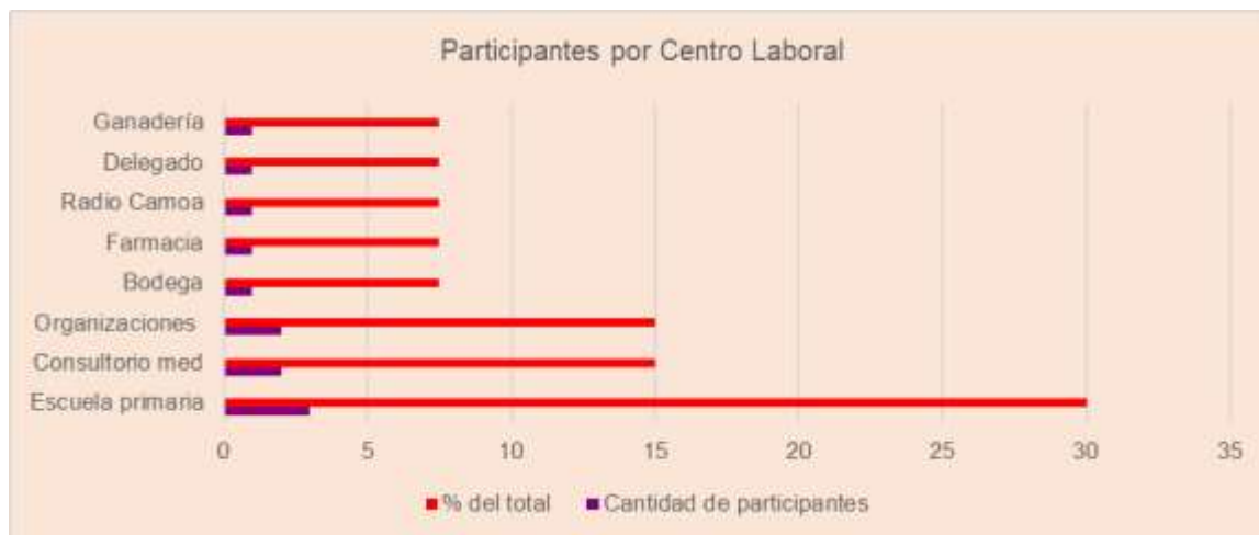
Gráfico No. 10.

Además, el 30% de los actores locales que participaron en este I Taller, pertenecen a la Escuela Primaria de la comunidad y el 15% al Consultorio médico y organizaciones de masa. Los demás pertenecen a diferentes instituciones comunitarias y del territorio.