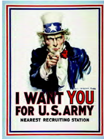
FIGURA 3 Propaganda de reclutamiento, Estados Unidos (1917)