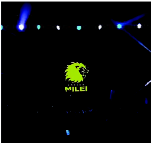
FIGURA 2 Isologo Milei. Cierre de campaña PASO