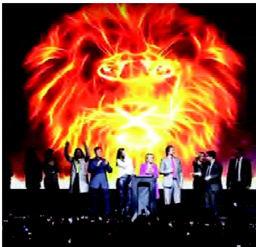
FIGURA 1 León en llamas. Cierre de campaña PASO