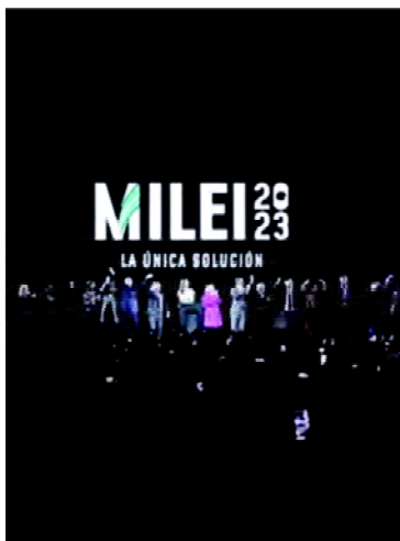
FIGURA 5 Logotipo Milei. Cierre de campaña PASO