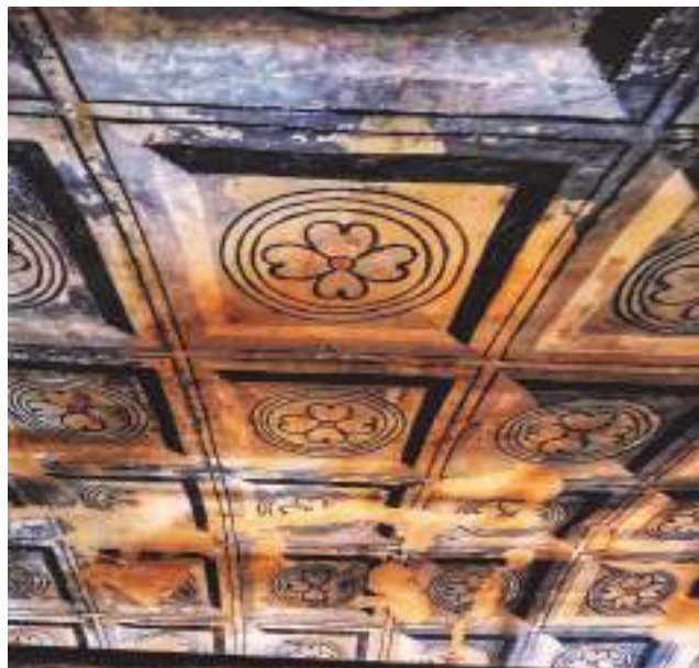
Arriba y abajo, detalles de las pinturas murales de la iglesia de Olejua.