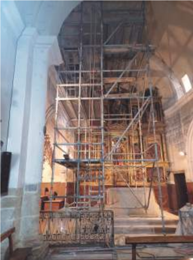
La iglesia durante la restauración de las pinturas.

del s. XVIII. El templo se compone de una nave de cuatro tramos articulados por dobles arcos fajones y bóvedas de cañón apuntadas con una cabecera semicircular.