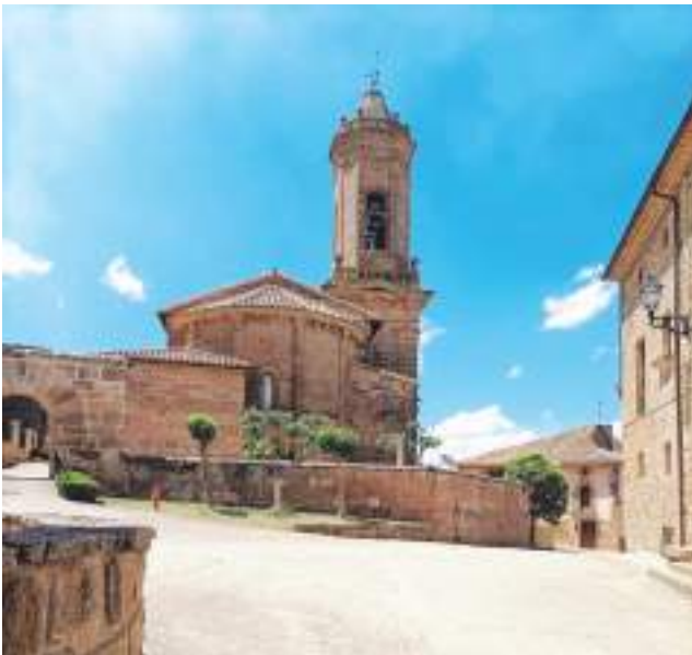
Vista de la iglesia (izquierda) y general (abajo) de Olejua.

La iglesia de Olejua es una mezcla de estilos románico rural del siglo XII y protogótico con un retablo romanista (1600) de la escuela de Juan de Ancheta, obra de González de San Pedro y policromado por Lucas de Salazar, sin olvidar la bella torre neoclásica