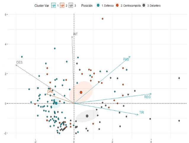
Figura 2. PCA Biplot según la demarcación de los jugadores. PAS = pases; REG = regates; TIR = tiros; INT = intercepciones; DAE = duelos aéreos; DES = despejes.

de aumentar el poder estadístico de la muestra, los DEL hubieran realizado también un número de TIR estadísticamente mayor que los CEN ( W=3.15, p = .067 ). En cuanto a la variable INT, no se observaron diferencias entre DEF y CEN ( W = 3.19, p = .062 ), mientras que si existieron diferencias estadísticamente significativas entre DEF y CEN en comparación con los DEL (DEF vs DEL: W = -6.72, p < .001 ; CEN vs DEL: W = -8.25, p < .001 ), siendo esta demarcación (DEL) la que menos acciones de INT realizó. Con respecto a la variable DAE solo se observaron diferencias significativas entre DEF y CEN ( W = -3.72, p = .023 ), siendo los segundos (CEN) los que menos DAE realizaron. Por último, para el recuento de DES, se observaron diferencias significativas entre todas las demarcaciones, (DEF vs CEN: W = -9.59, p < .001 ; DEF vs DEL: W = -16.01, p < .001 y CEN vs DEL: W = -7.75, p < .001 ) con valores superiores para los DEF, seguidos de los CEN y por último por los DEL.