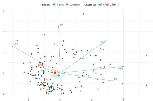
Figura 3. PCA Biplot según segmentación por la localización del partido. PAS = pases; REG = regates; TIR = tiros; INT = intercepciones; DAE = duelos aéreos; DES = despejes.

En el resto de variables objeto de estudio no se han observado resultados que nos permitan afirmar que existen diferencias estadísticamente significativas entre la condición de local y la de visitante.