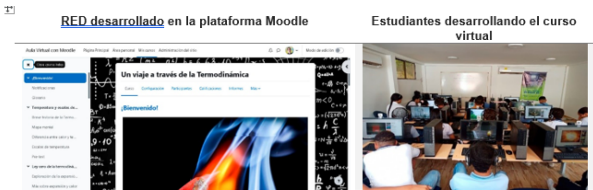
Tabla 5 Implementación del curso virtual en Moodle elaboración propia (2023).

Al integrar este contenido al desarrollo del RED en la plataforma Moodle e implementarlo con los estudiantes, se observa en la tabla 5.