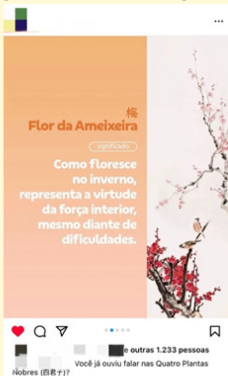
Figura 3: Captura de ecrã relativamente à publicação sobre méi