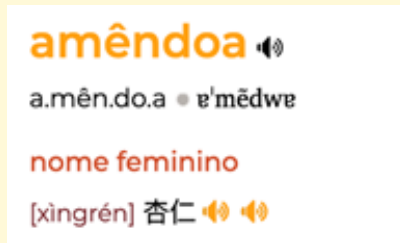
Figura 2: Designação em relação a “amêndoa” em Chinês na Infopédia da Porto Editora