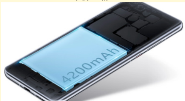
Figura 5: Captura da tela da página do Huawei P40 Pro da China e do Brasil