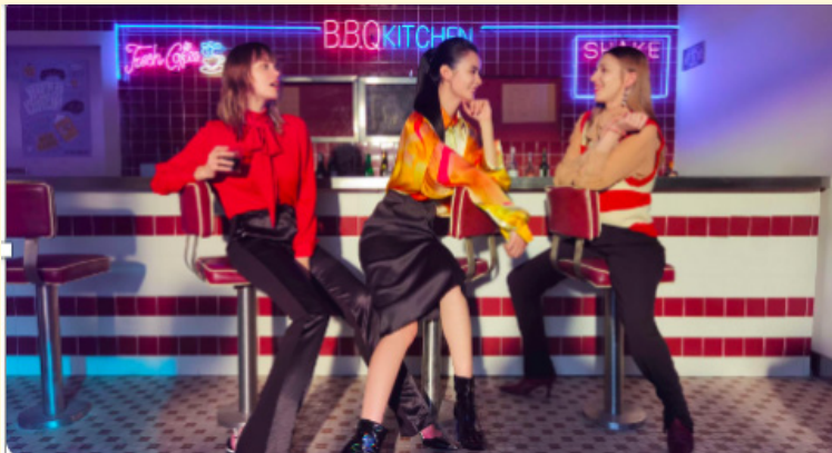
Figura 3: Captura da tela da página do Huawei P40 Pro da China e do Brasil