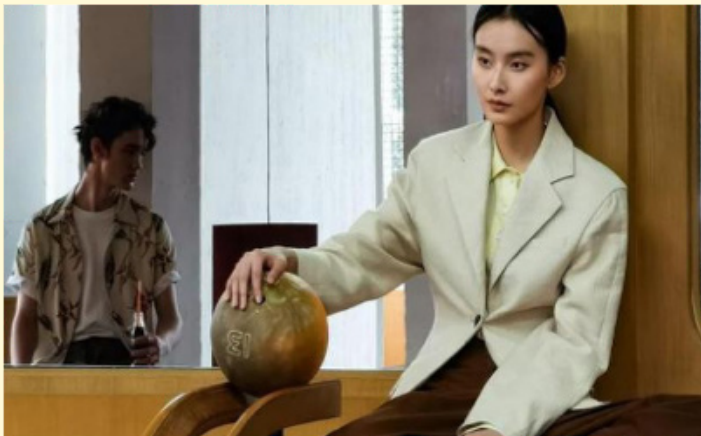
Figura 2: Captura da tela da página do Huawei P40 Pro da China e do Brasil