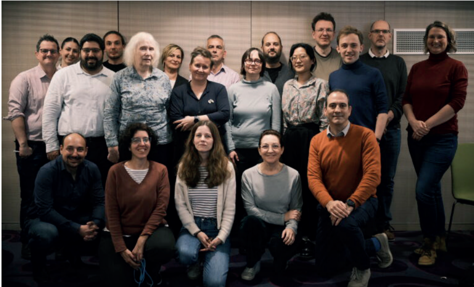
Reunión de Knowledge Rights 21 en Bruselas (abril 2024)

En España, la Federación Española de Sociedades de Archivística, Biblioteconomía, Documentación y Museística (FESABID) ha firmado un acuerdo con el programa europeo Knowledge Rights 21 (KR21) en esta línea de asegurar el derecho de acceso a la investigación, la educación y la cultura en el siglo XXI.