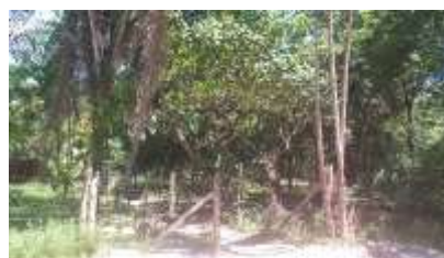
Figuras 2 e 3: Faixa da orla urbana do tipo agrícola onde há criação de animais e culturas agrícolas.