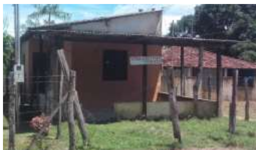
Figura 1: Residência desocupada com anuncio de venda.

Fonte: Foto retirada pelo autor, ano 2017.