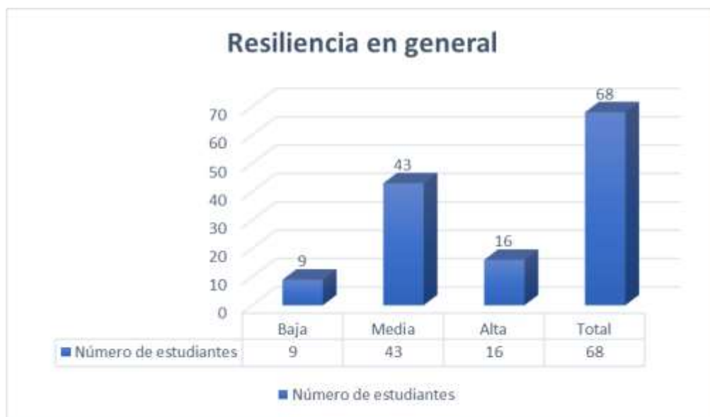
FIG. 1. RESILIENCIA EN GENERAL DE LOS PARTICIPANTES

Como parte de la investigación se hizo la aplicación de los instrumentos de recolección de la información, se procedió a realizar el análisis e interpretación de los datos obtenidos y los resultados fueron los siguientes: