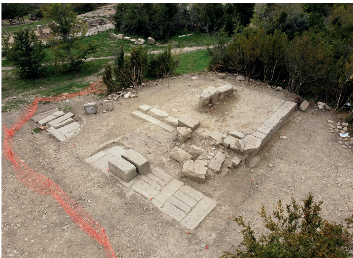
Figura 3. Sondeo 7, en primer plano muro de cierre del foro al este y a continuación restos del podio monumental de templo.

(Armendáriz, 2009, p. 655; Romero, 2014, pp. 206-207), aunque interpretado desde su hallazgo como depósito final del acueducto ( castellum aquae ) (Mezquíriz & Unzu, 1988, pp. 303-304; Mezquíriz, 2009, pp. 140-142). Esta construcción tampoco dispone de molduras en la zona más baja del podio, aunque la estructura del alzado es algo diferente al del edificio que nos ocupa. Este aspecto se observa también en otros templos de la Tarraconense, como, por ejemplo, el templo de Vic (Domingo et al., 2008, p. 596, n.º 10).