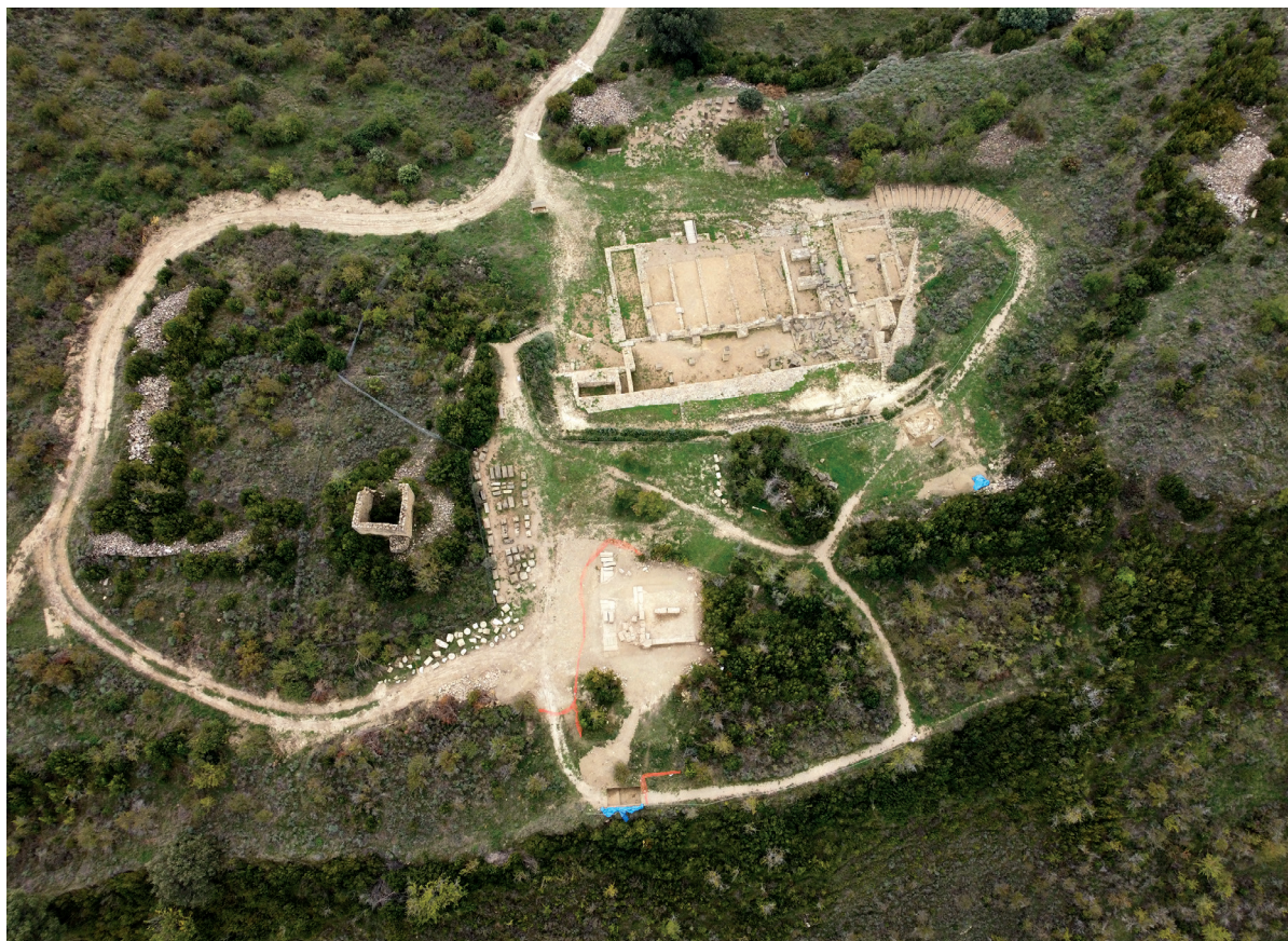
Figura 1. Plataforma superior donde se emplaza el forum de Santa Criz. Localización de los sondeos de la campaña de 2023. Autoría: J. Cirez.

delimitación O del mismo. Tras la excavación de los niveles superficiales, fruto del acondicionamiento del camino del circuito turístico (UE 23601) y la deposición de arcillas y limos por escorrentías (UE 23602), aparece un nivel arqueológico de abandono caracterizado por la presencia de arcillas compactas (UE 23603). Bajo ello, se identificaron dos niveles de derrumbe, uno al suroeste compuesto por gravillas compactadas (UE 23608) y otro al norte compuesto por piedras irregulares de tamaño pequeño y mediano (UE 23605). Estas piedras formaban parte originalmente del muro de mampostería localizado al este del sondeo (UE 34604). Un muro de doble paramento con una orientación noroeste-sureste (2,76 m