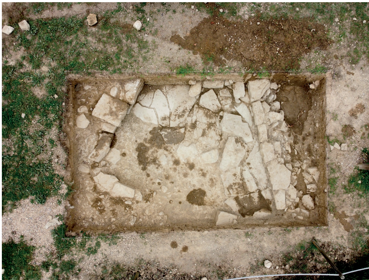
Figura 2. Fotografía cenital del sondeo 6, situado al oeste de la plataforma forense de Santa Criz.

edificio dado que existe un expolio estructural y no se ha intervenido en los extremos sur y oeste. La interpretación funcional del edificio por su arquitectura y la posición central en la articulación del foro no deja lugar a dudas de que estamos ante el templo principal del centro cívico de la ciudad.