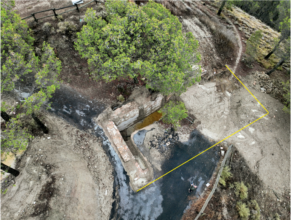
Figura 4. Imagen del aljibe con su hipotética superficie desde una perspectiva aérea. Autoría: Iñaki Sagredo.