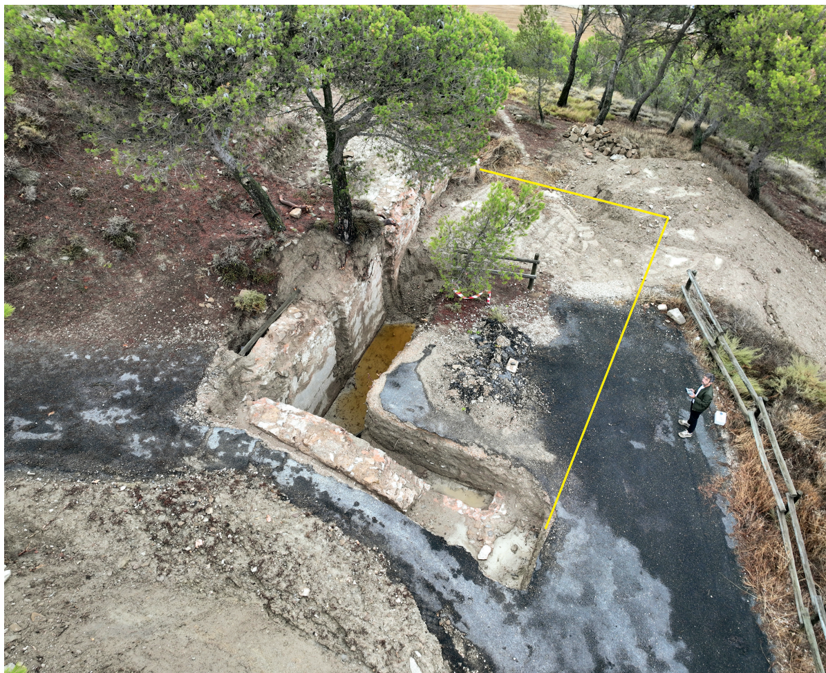
Figura 2. Espacio que pudo ocupar el aljibe junto al camino.

exigió a los habitantes de Berbinzana que abandonaran sus hogares y se refugiaron en el castillo de Larraga ante la llegada de las grandes compañías de mercenarios que desde Francia atravesarían Navarra para dirigirse a Castilla. Era por tanto lógico que esta fortaleza contara con una zona adaptada para resguardar a una amplia población.