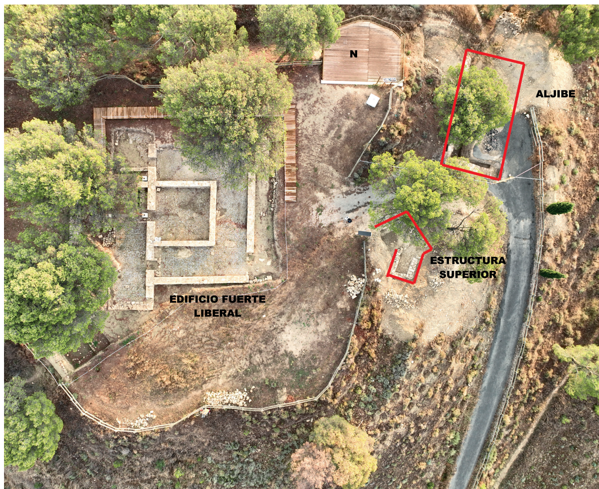
Figura 1. Ubicación de los elementos intervenidos en la campaña arqueológica 2023. Autoría: Iñaki Sagredo.

por lo que solo son visibles las rozas realizadas para la construcción de las columnas en una pared de tapial construida inicialmente. Tampoco quedaron restos de la bóveda, por lo que, en el momento de ser sepultado por lodo y piedras para crear un talud, las piedras fueron retiradas para su aprovechamiento. Tampoco parecen existir muchas evidencias de los muros sur y este, pues apenas quedan sus cimientos.