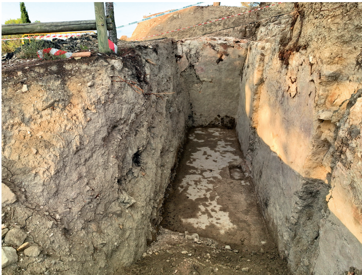
Figura 5. Imagen del suelo de cal de la cisterna. Al fondo el muro con forma de cierre de bóveda.