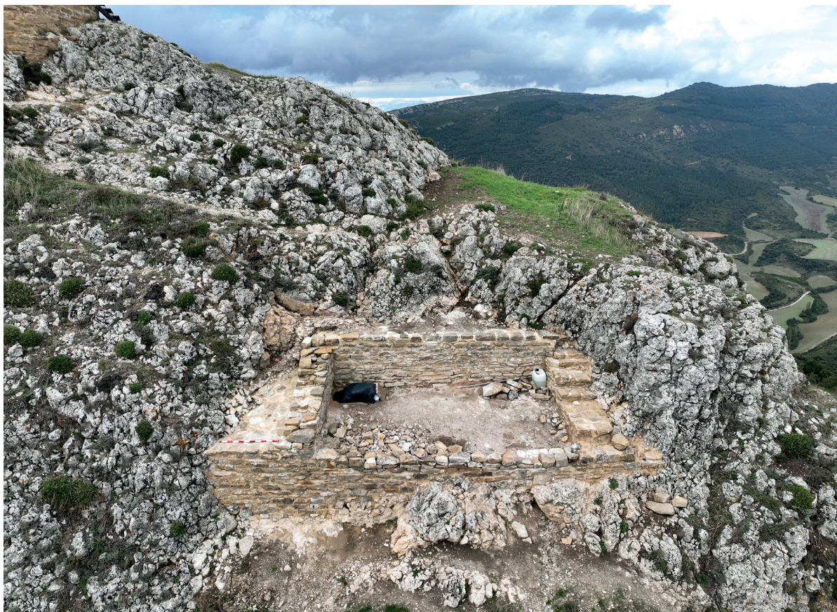
Figura 7. Aljibe en toma aérea. Aún falta por concluir la parte final del suelo y cierre superior. Autoría: Iñaki Sagredo.

patrimonio con riesgo de desaparición a una puesta en valor donde los vecinos sean pieza fundamental de su recuperación. La profesionalización tiene su parte para el control de los