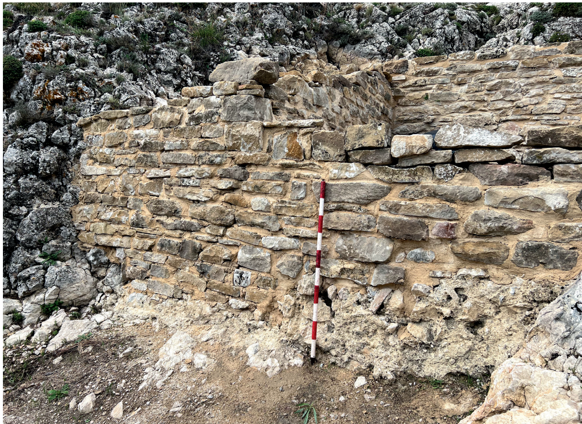
Figura 8. Detalle del trabajo de consolidación sobre la argamasa original de la base. Este punto estaba totalmente arrasado por la erosión. Autoría: Iñaki Sagredo.