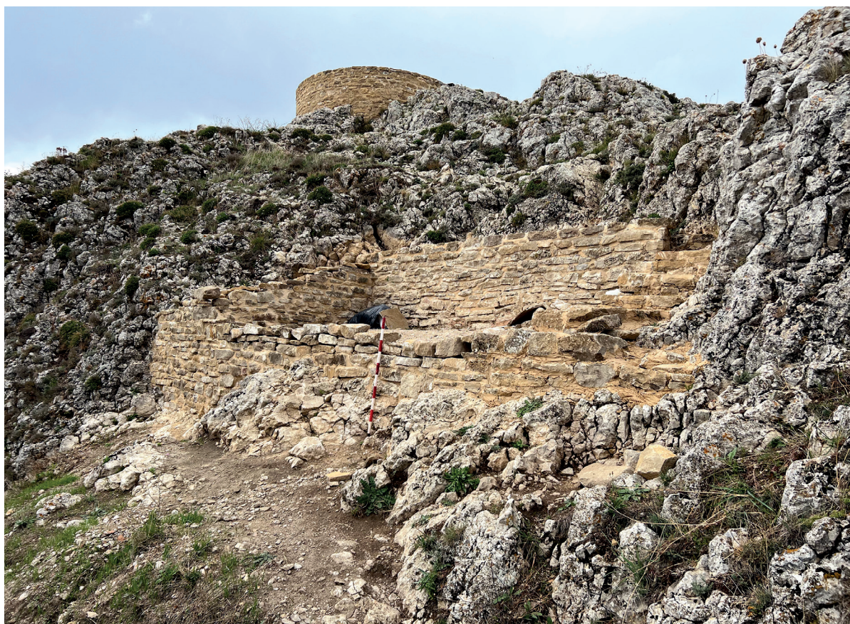
Figura 6. Imagen muro oeste y norte consolidados. En la parte superior la torre del homenaje. Autoría: Iñaki Sagredo.

trucción-consolidación en un lugar abrupto, a 1000 metros de altitud y sin posibilidades mecánicas, siendo toda la labor manual, con el transporte de material de sacos y agua desde un kilómetro de distancia uno a uno o haciendo cadenas humanas para subir la piedra. Es por tanto necesario subrayar la colaboración de la gente de los pueblos cercanos en trabajo vecinal (auzolan). Sin esta labor, poco se hubiera podido hacer y mucho menos conseguir a futuro el cuidado, pues es primordial asociar el esfuerzo de los trabajos y sus resultados a la memoria del colectivo, lo que facilitará su control y mantenimiento. Este punto ha sido un interés personal desde que se comenzaron con los trabajos de puesta en valor de los castillos desde el 2009, con los de Irurita, Garaño, Aixita, Larraga y Unzué, asociar este