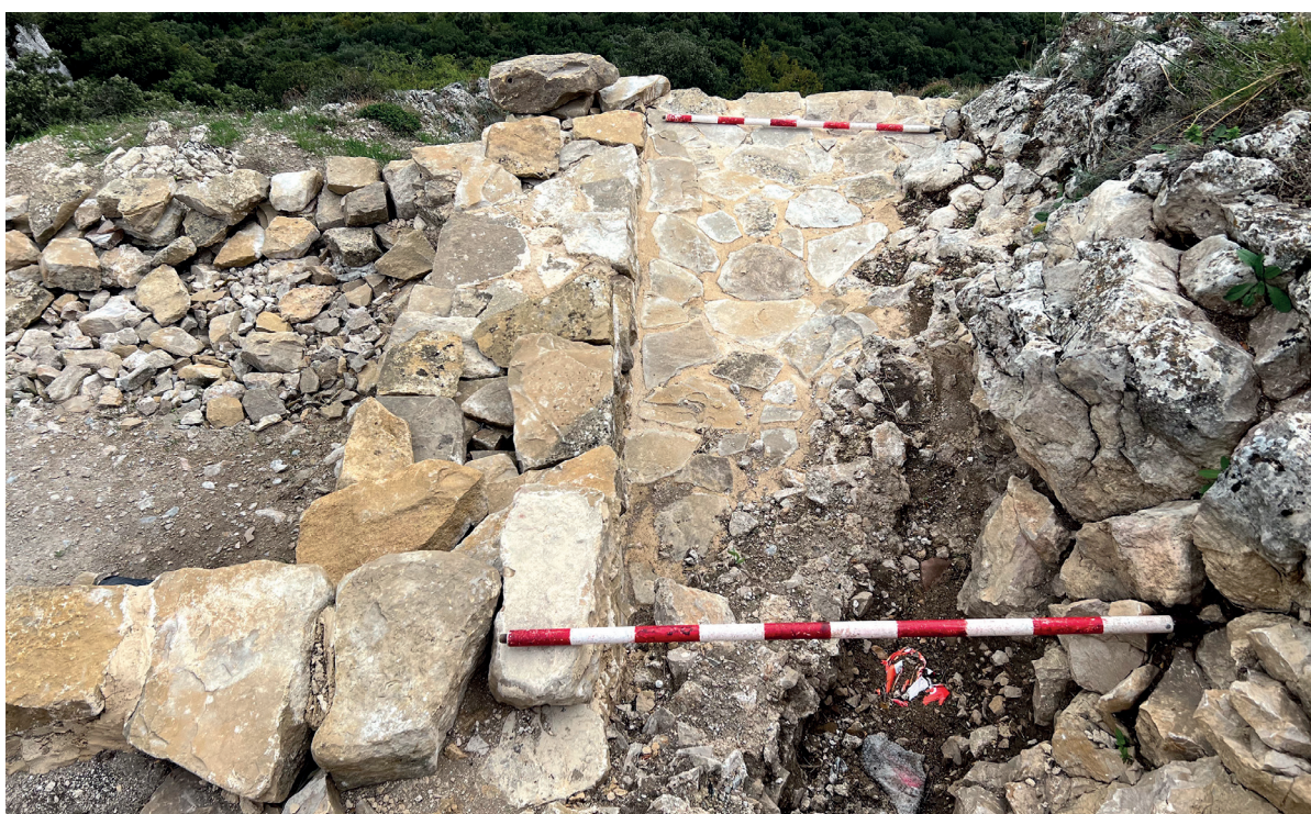
Figura 5. Parte cimera del muro oeste con zona de pendiente y cierre para canalizar el agua de las escorrentías. Autoría: Iñaki Sagredo.