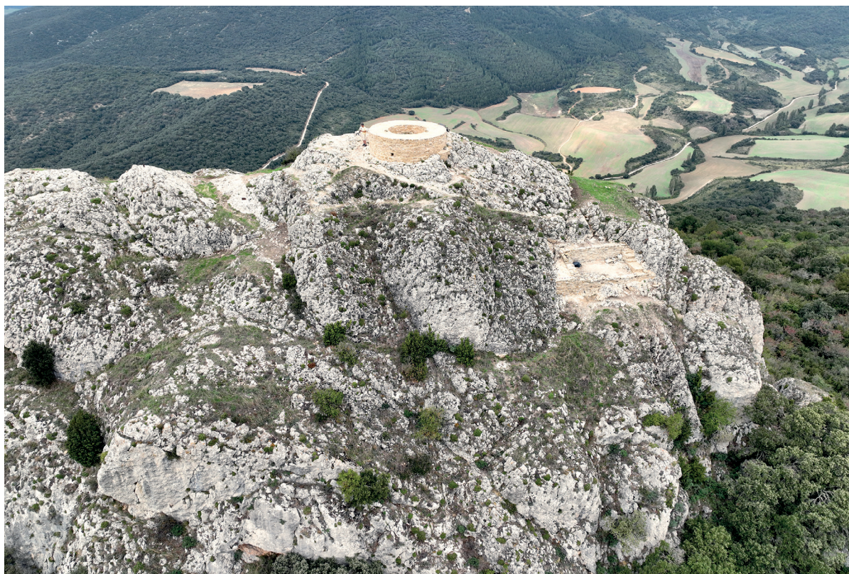
Figura 1. Toma aérea del castillo de Guerga.

1. INTRODUCCIÓN. 2. ACOPIO DE MATERIALES. 3. PROCESO DE LA CONSOLIDACIÓN. 4. CONCLUSIÓN.