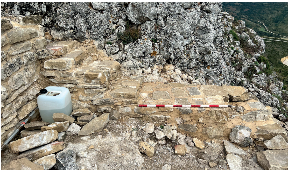
Figura 4. Muro este. Autoría: Iñaki Sagredo.