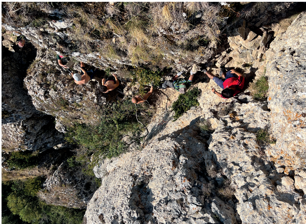
Figura 3. Proceso de la complicada subida por la peña. Autoría: Iñaki Sagredo.