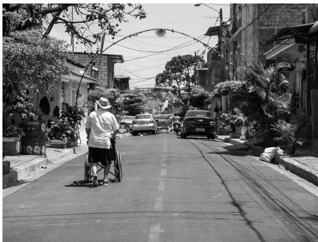
Figura 3 Infraestructura de Bastión Popular