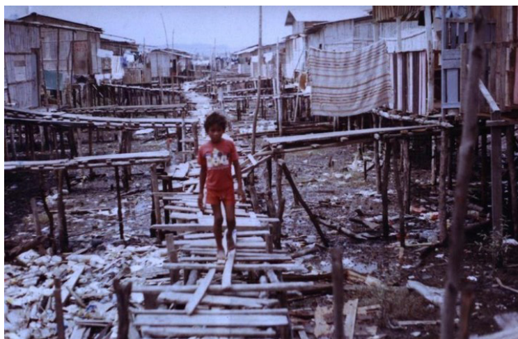
Figura 2 Barrio Nigeria circa 2003