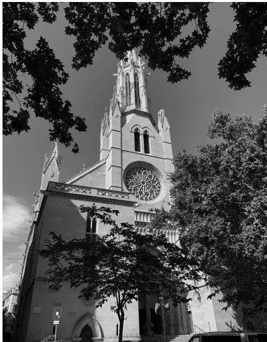
Fig. 1. . Fotografía del exterior actual de la fachada principal.

El templo parroquial de Santa Eulalia de Palma [Imagen 1 y 2], desde el punto de vista histórico, es una de las iglesias más antiguas e importantes del patrimonio cultural de Mallorca. Destaca por ser uno de los primeros edificios religiosos en construirse tras la conquista de la isla en 1229, sirviendo como espacio de reunión para las juntas del Reino entre 1256 y 1300. Se edificó desde el presbiterio hasta sus portales laterales entre los siglos XIII y XIV, 1 continuando con la construcción de su nave central y las dos laterales entre los siglos XV y XVI. 2 Durante el siglo XVII se finalizó su portal y fachada principal, aunque esta última sufrió diversas intervenciones y reconstrucciones entre los siglos XVIII y XIX. Está situada en el centro histórico de la ciudad de Palma, próxima a otros monumentos importantes como la Catedral o el Palacio Real de la Almudaina y los edificios más representativos del poder político y económico local, ocupando un lugar emblemático en el trazado urbanístico desde la época medieval. 3