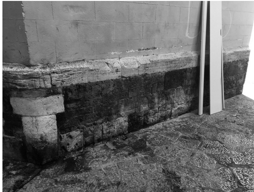
Fig. 5. Fotografía del exterior del ábside del templo donde se aprecian pintadas y humedades.

se viene produciendo un mayor deterioro de sus inmediaciones a causa de la colocación de contenedores de residuos municipales pegados a las fachadas exteriores, que desencadenaron diferentes daños sobre el inmueble, y la proliferación de pintadas vandálicas sobre sus muros del presbiterio y fachada este [Imagen 5].