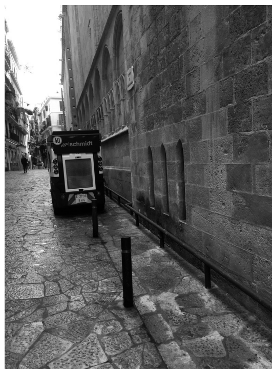
Fig. 4. Fotografía de estado actual de la misma calle.

Partiendo de estos antecedentes, la situación actual de este entorno de protección sigue sin ser clara y se ha visto drásticamente perjudicada durante los últimos años. Desde el año 2011,