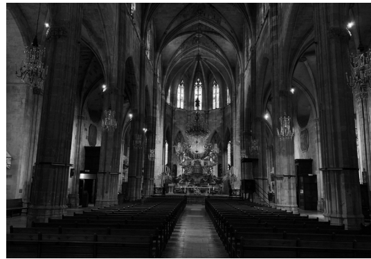
Fig. 2. Fotografía del interior del templo.