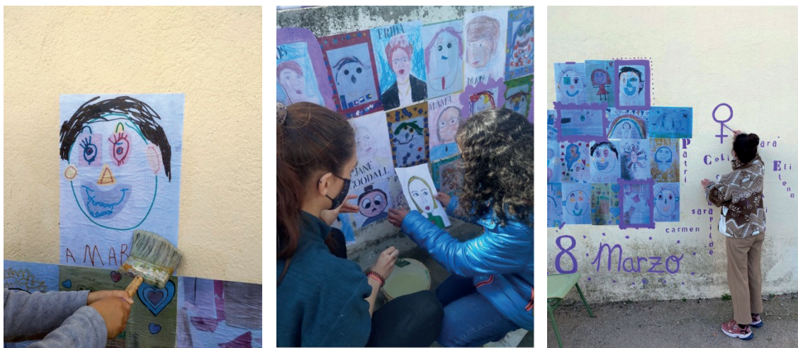
Fig. 3. Procesos de intervención mural colaborativa. A la izquierda, Usanos; en el centro, Iriépal; a la derecha, Taracena

Gracias a esta técnica mural se consigue respetar —de manera visual— el ritmo, la técnica original, y el proceso de la representación gráfica infantil de cada niña, ya que los dibujos realizados serán los que se lleven directamente al muro, sin modificar las piezas originales.