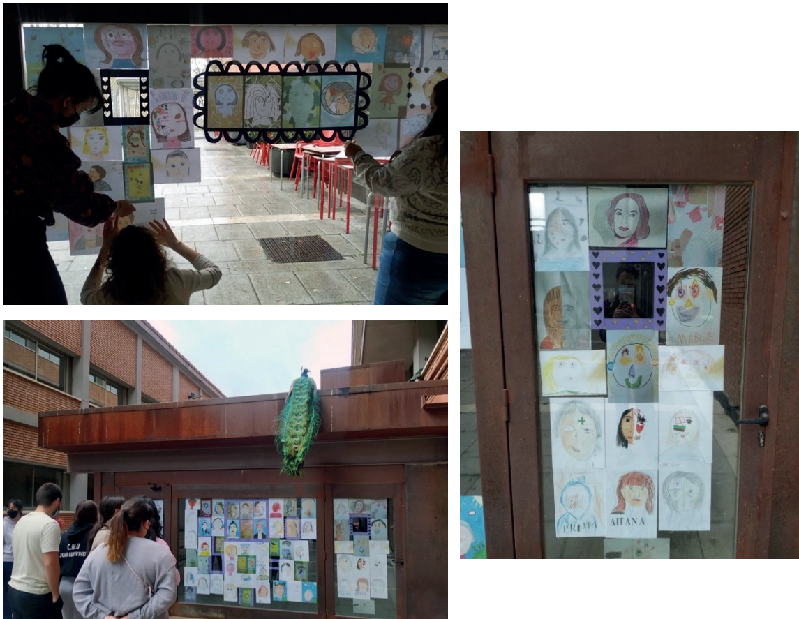
Fig. 4. Intervención en la cafetería de la Facultad de Educación de la UAH

Las estudiantes de la universidad diseñaron en equipo una composición que contaba, no solo con los retratos, sino también con breves explicaciones, pósteres, muestras fotográficas que documentaban los vínculos establecidos y el proceso llevado a cabo, y algunos marcos y ornamentaciones para resaltar algunos dibujos o, incluso, dejar espacio para los nuevos que pudiesen aparecer, para invitar a las personas espectadoras a intervenir y colaborar en la transformación del espacio.