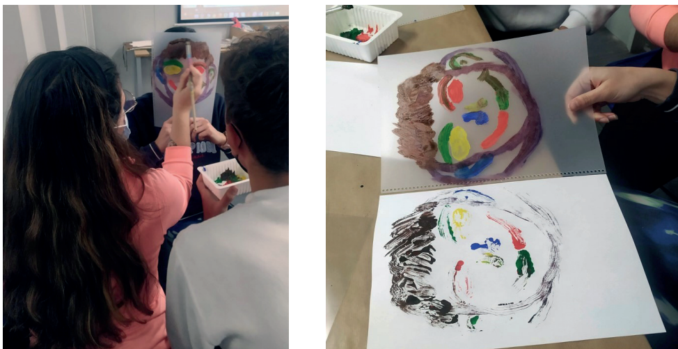
Fig. 1. Alumnado de la Facultad de Educación atestiguando la propuesta que han programado para el alumnado de Educación Primaria del CRA

Al igual que esta alumna de la Facultad, muchas sintieron alegría y frustración a partes iguales. Gesto que supone la necesidad de establecer vínculos activos entre colegios y universidad, más allá de las propias prácticas que las estudiantes de la Facultad realizan cada año. Visitas de este tipo les permiten conocer los diferentes tipos de centros escolares, así como poder llevar a cabo sus propios talleres para fomentar la autonomía, la seguridad y la autogestión como futuras maestras. Les proporciona poner en práctica lo aprendido de manera teórica y alimentar su autoestima —gesto vital dentro de un aula o comunidad educativa, pues es necesario sentirse segura de lo que estás haciendo y de cómo lo estás haciendo, además que se forja con la propia práctica, por lo que cuanto antes empiecen, mejor—.