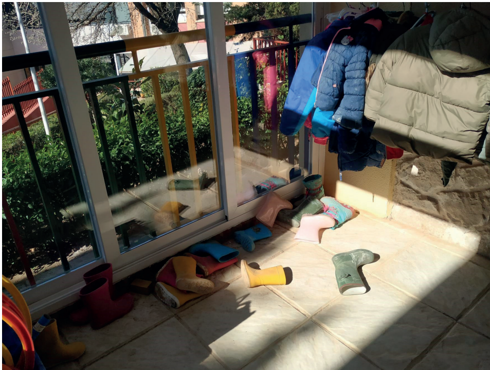
Fig. 7. Un día de lluvia en la escuela rural de Iriépal

Me sorprendió la sensación que tuve de sentir casi por primera vez que la teoría y la práctica tenían relación. Estoy algo cansada de escuchar la frase: «aprender a aprender» o la idea de que el profesorado también aprende de sus alumnos porque pocas veces he coincidido con un entorno de profesores que sienta que realmente todos piensan así. En Iriépal sentí que los maestros disfrutaban verdaderamente de su profesión y que tenían muchas ganas de seguir aprendiendo y poniendo en práctica sus conocimientos para un bien común. (E. 16, comunicación personal)