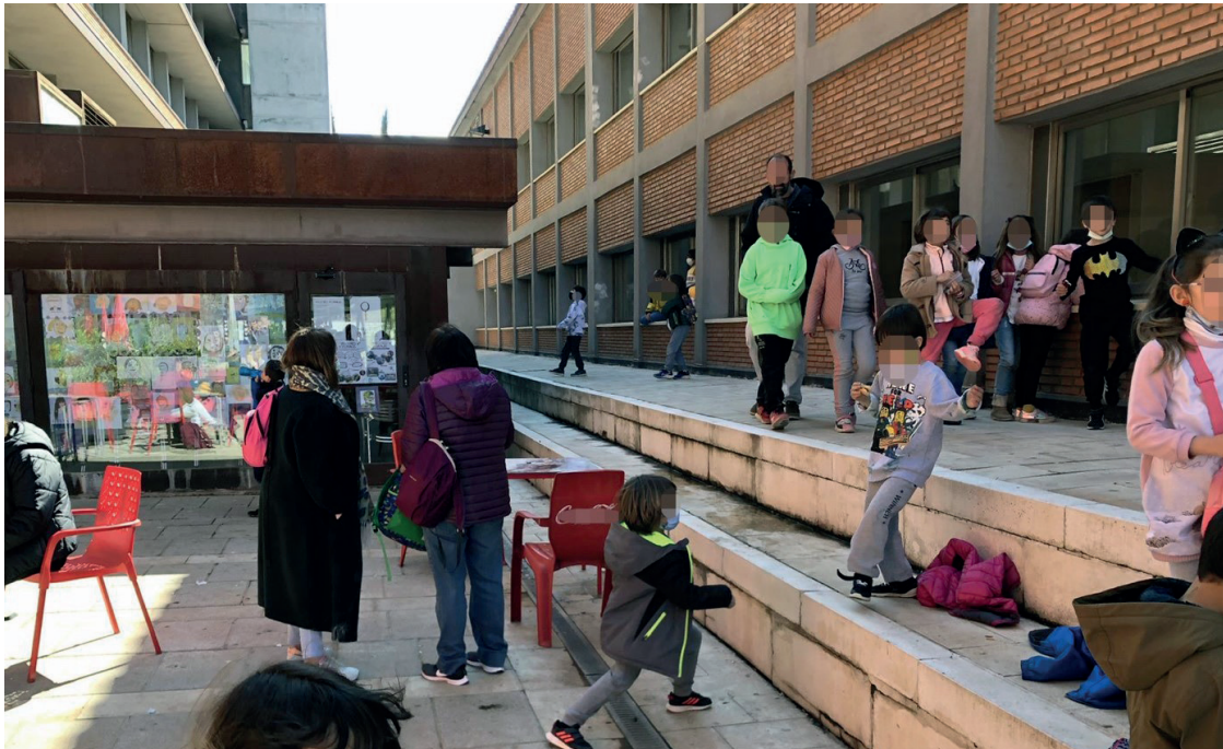
Fig. 6. Visita de estudiantes del CRA Francisco Ibáñez a la Facultad de Educación de la UAH