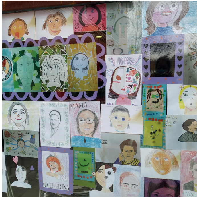
Fig. 9. Mujeres Plurales en la Facultad de Educación de la UAH

Nota: En la imagen se observa la diversidad de mujeres retratadas en cuanto a edad, época, profesión o vinculación que pueda tener con las personas que las han representado (estudiantes tanto de universidad como de Educación Infantil o Primaria).