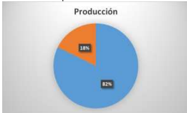
Ilustración 3. Representación del software con licencia (paga) con respecto a la producción