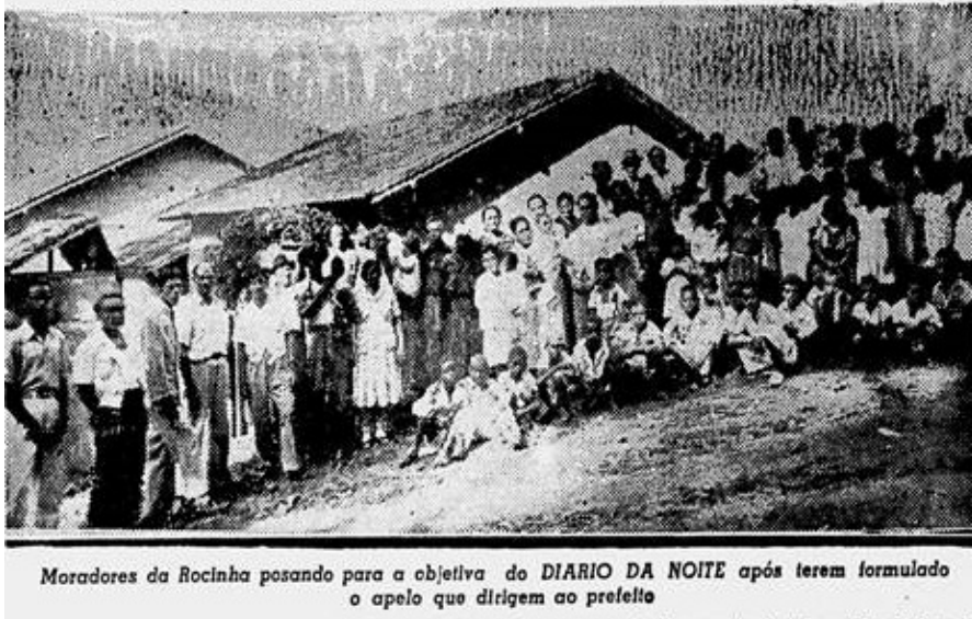
Figura 1. "Do que necessita o seu bairro?"

Moradores da Rocinha posando para a objetiva do DIÁRIO DA NOITE após terem formulado o apelo que dirigem ao prefeito