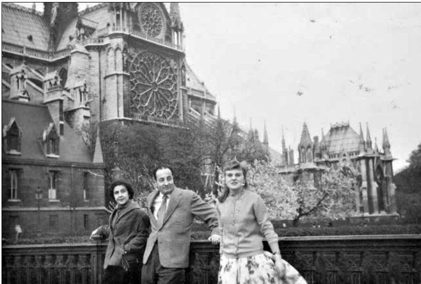
Imatge icònica de Palau Ferré a Notre Dame de París.

En el cas de Maties Palau Ferré i la seva aureola d'artista internacional marcat pels seus anys a París, la fotografia analògica que centra aquest estudi ofereix precisament aquesta capacitat objectiva de plasmar en temps real, i en una sola imatge, tot allò que el París de final dels anys cinquanta suposava per als actius de la cultura catalana, que s'esforçaven per avançar propostes avantguardistes en el context del franquisme i la llarga postguerra.