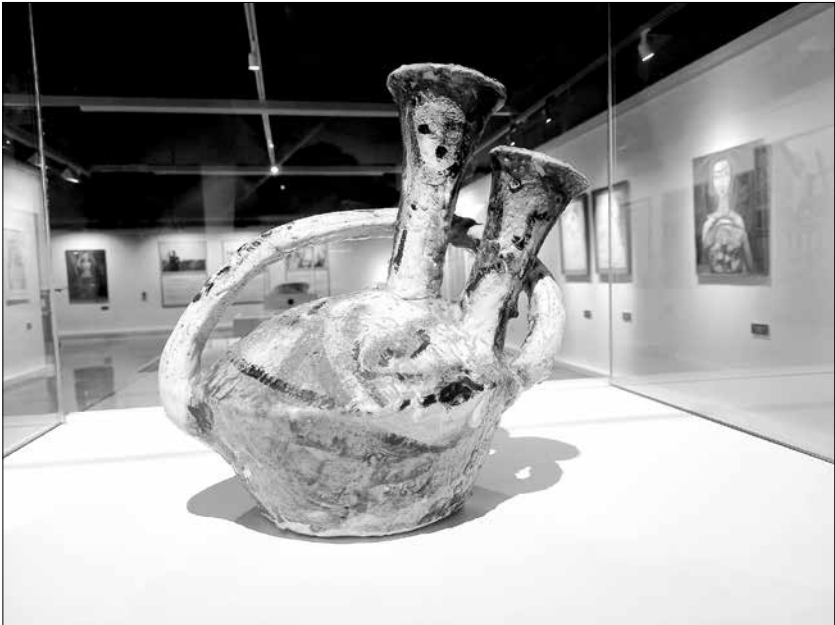
Parella. Ceràmica policromada de Maties Palau Ferré