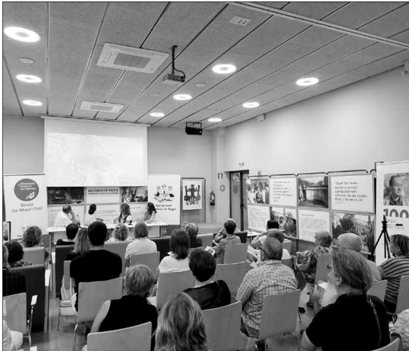
Acte a Artesa de Segre en el marc de l'Any Palau Ferré