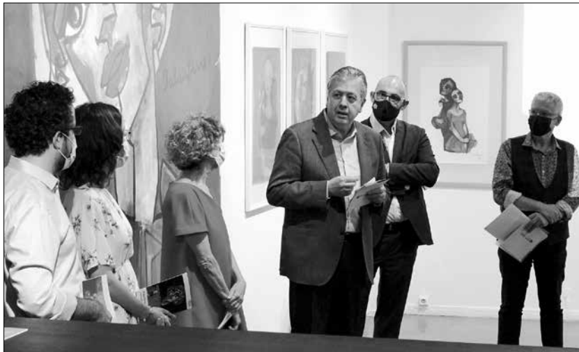
Inauguració de l'exposició de l'Any Palau Ferré a l'Institut Françaís de Barcelona.