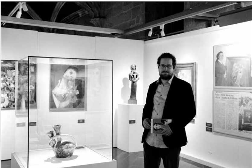
La ceràmica d'Artesa de Segre a l'exposició de l'Any Palau Ferré a l'IEI