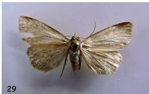
Photedes minima (Haworth, 1809) (Fig. 29)

Material estudiado: Suárbol (29TPH74), 1445, 23-VII-2020, 1♂ (genitalia preparación nº NO0661 D.C. Manceñido col.) mediante trampa lumínica alimentada con batería, J.M. González leg., D.C. Manceñido det. y col. Nueva para Castilla y León.