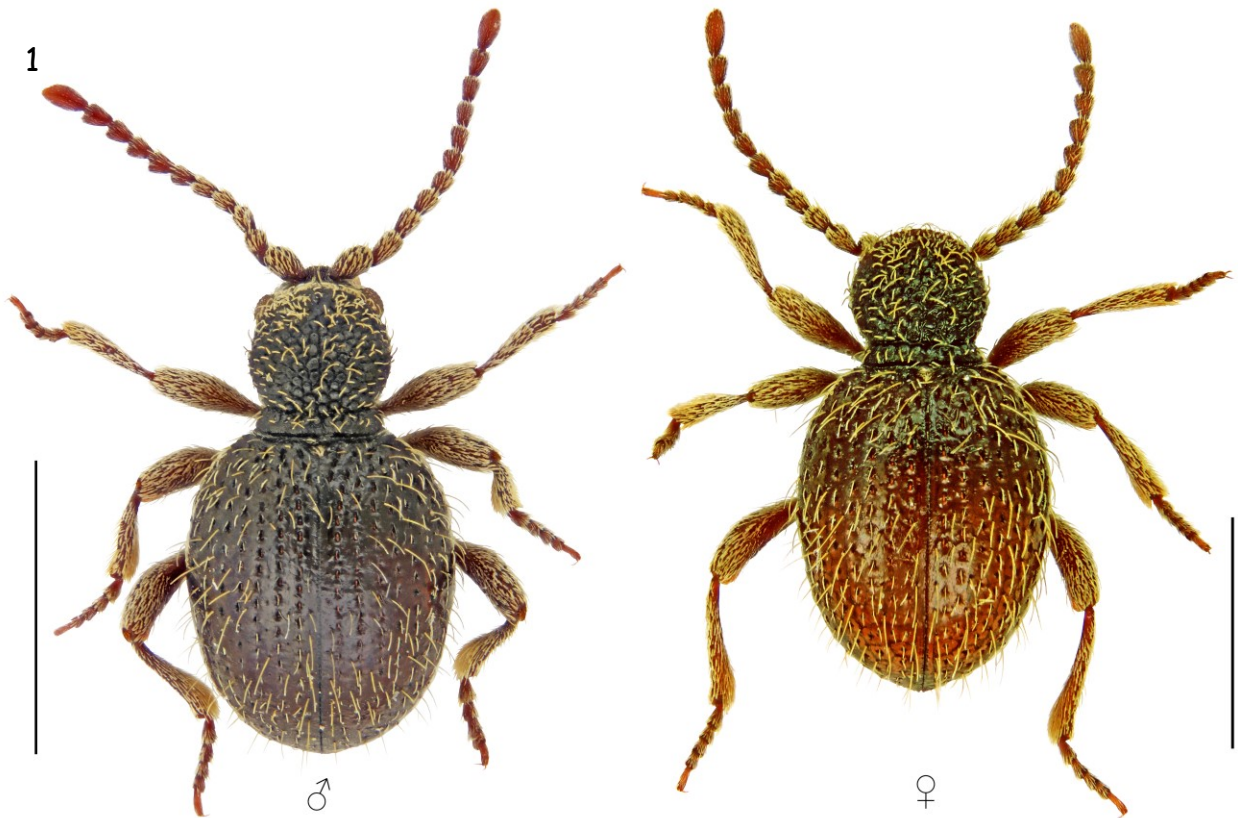
Fig. 1. - Niptodes (Niptodes) ferrugulus (Reitter, 1884). Habitus del macho y la hembra. Escala = 1 mm.