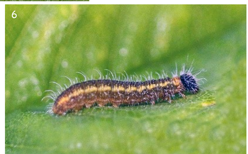
Figs. 3-6.- Spialia rosae Hernández-Roldán, Dapporto, Dincă, Vicente & Vila, 2016.