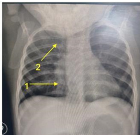
Figura 1: Radiografía de tórax, consulta en puerta de emergencia. Se destaca Flecha 1. Opacidad inhomogénea paracardíaca derecha. Flecha 2. Atelectasia en vértice derecho.

Dado el conteo de glóbulos blancos y la placa con opacidad inhomogénea se comienza tratamiento antibiótico con ampicilina