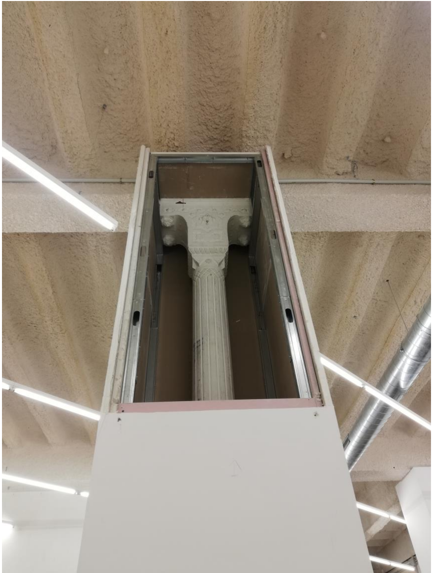
Imagen 1. Broto, L. (2022). Exponer las columnas.