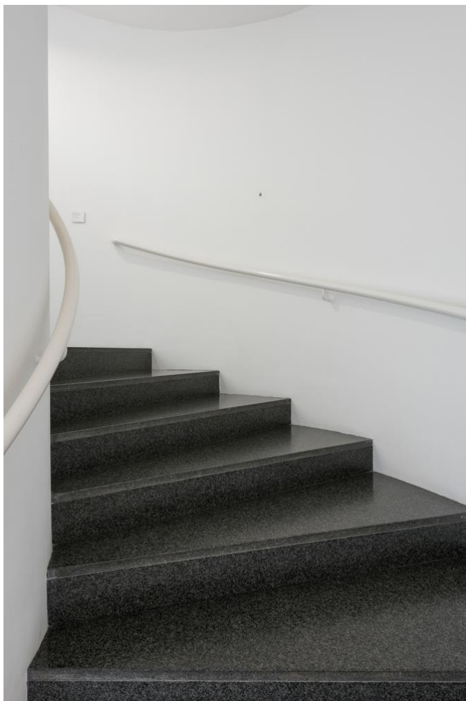
Imagen 2. Broto, L. (2015). Abrir un agujero permanente. De https://luzbroto.net/abrir-un-agujero-permanente/