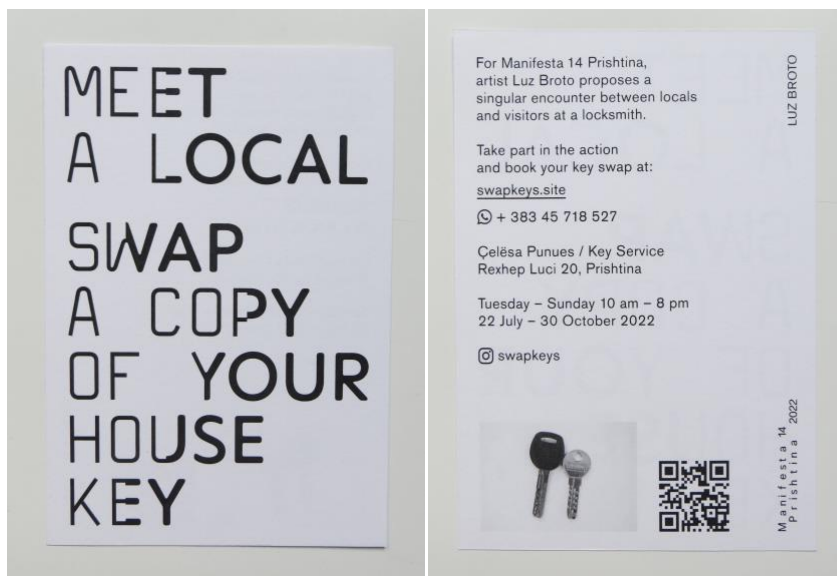
Imagen 4. Broto, L. (2022). Postal en inglés para anunciar el proyecto Swap Keys en la bienal Manifesta 14 Prishtina.

entender cómo a través de las proposiciones de Broto, ella intenta revelar el distanciamiento que experimentamos en el habitar contemporáneo y de alguna manera anularlo, así sea por tan solo unos minutos. En esta proposición el lugar de relación es la cerrajería, pero la idea parte del habitar la vivienda. En esta acción lo privado –simbolizado por las llaves- ocupa un lugar en el ámbito público. Las llaves son el elemento que representa el espacio ocupado por los colaboradores y en el acto del intercambio la confianza es el vínculo entre los dos participantes. La artista indica que acortar distancias entre los cuerpos, ir al encuentro del otro, es un común denominador de sus obras (Broto, 2021) y explica que todo nace a partir de trabajar sola en el espacio del taller, por lo que busca a partir de ese sentimiento conectarse con otros, abrirse a los demás (Broto, 2015). Para Luz Broto “el espacio es lo que permite la relación” (2015, 15’40”), se refiere a ese vínculo entre el espacio de dentro y de afuera, además de la relación con el “otro”.