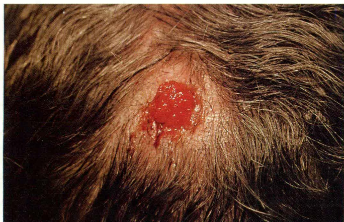
foto 1. SIRINGOCISTADENOMA PAPILIFERO

El paciente presentaba una lesión tumoral exofítica sésil de 1.5 cm de diámetro, friable, eritematosa, que