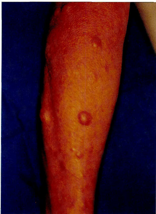
Fig. No. 1. Nódulos cutáneos leucémicos sobre superficie cutánea infiltrada por Lepra Lepromatosa.