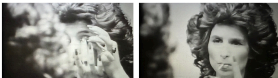
Fig. 7 e 8: frames da sequência do monólogo no quarto e no banheiro do motel

Aos 11 minutos de filme, tem início um monólogo apresentado na forma de uma narração em off proferida pela mulher, acompanhada de imagens em preto e branco gravadas em um quarto e banheiro de motel (Fig. 7 e 8) e nas quais, diferentemente da conversa informal em sua casa, a personagem inicia um processo de autorreflexão sobre seu corpo, seu gênero e sua sexualidade, ao mesmo tempo em que se monta mais uma vez.