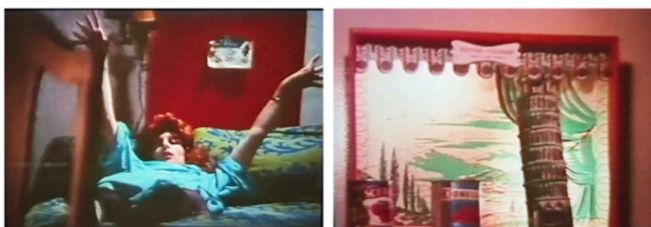
Fig. 5 e 6: frames da cena em que a mulher fala de seu sonho romântico

telefônica, quando de fato só pouparia o espectador), a mulher se dirige ao cineasta, quebra mais uma vez e quarta parede, vira o rosto, olha ansiosamente para o chão e para o lado, coloca a mão no colo de forma bastante afetada e muda de assunto. Se produz aí, então, mais um momento em que a inautenticidade flagrante reivindicada pelo próprio discurso da personagem enseja mais uma produtiva confusão entre vida vivida e vida na imagem. Ela se dirige ao seu quarto, mostra uma parede e diz: “Quando estou triste eu fico olhando para meu diorama. Me ajuda muito a dormir à noite.” Em seguida deita na cama e, olhando para a câmera, continua enunciando seu romantismo de artifício (Marconi & Almeida, 2022): “Durmo e sonho com a Itália, com uma aventura selvagem e romântica em Roma ou algo do tipo. Ou até Pisa, acho, por causa da torre e tudo.”