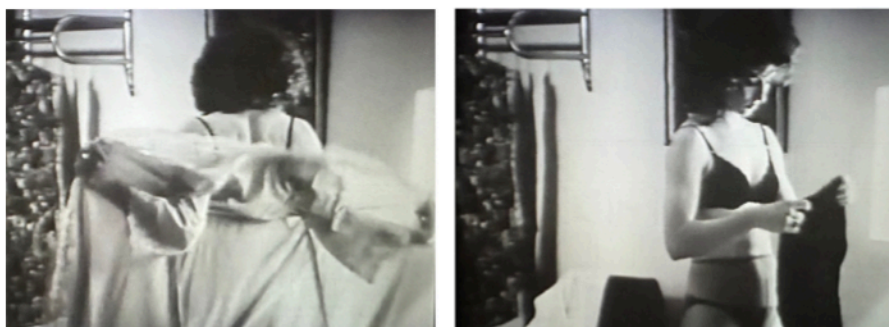
Fig. 9 e 10: frames da sequência do monólogo no quarto e no banheiro do motel

Nesse momento, a mulher começa a se despir do seu chambre claro, enquanto escolhe uma roupa em uma arara disposta ao fundo do quarto (Fig. 9 e 10). Aqui, a legibilidade de gênero da personagem fica ainda mais ambígua: se o filme nos convida em toda a sua duração a suspender a “classificação” mas o condicionamento heteronormativo do olhar vai nos impelir a todo tempo a assentar essa leitura para tentar rotulá-la, afinal, como mulher cisgênera ou transgênera (e esse ímpeto classificatório é normativo em si mesmo), essa sequência nos apresenta um convite à compreensão do gênero nos termos da travessia postulados por Paul Preciado, a aceitar um “entre”.