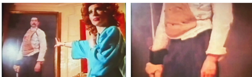
Fig. 3 e 4: frames da cena de apresentação do quadro (ou da foto do quadro)

rias de produção do filme. Como se vê também em outras passagens, temos a câmera mais uma vez muito próxima da personagem, sugerindo que o espaço físico do local não permitia uma distância maior, e vemos a luz utilizada na gravação refletida no próprio quadro do qual a mulher vai falar: “Eu adoro. Não é o quadro, é a foto de um quadro. Você vê? Ele tem uma ereção enorme. Eu acho muito divertido” (Fig. 3 e 4).