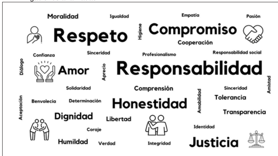
Figura 3 - Valores más importantes en la práctica docente de acuerdo con las investigaciones analizadas

Solamente en dos estudios se mencionó la dificultad de identificar los valores en la práctica, ya que éstos están relacionados con otras variables (que se presentarán más adelante como parte de los resultados). No obstante, se identificaron coincidencias en las investigaciones que señalan los principales valores manifestados por los profesores (Hirsh; Pérez, 2019; Suyatno et al. , 2019). En la figura 3, se muestran, en formato de nube de palabras, aquellos valores que se mencionaron en los resultados de las investigaciones analizadas: