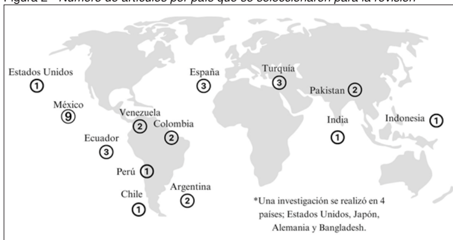
Figura 2 - Número de artículos por país que se seleccionaron para la revisión

El 34,3% (N=11) se realizaron en Centroamérica y Sudamérica; el 21,8% (F=7) en Asia; el 9,3% (N=3) en Europa y 3,2% (N=1) en Estados Unidos de América (EE.UU). Solamente una investigación (3,2%) fue llevada a cabo en 4 países pertenecientes a diferentes continentes (EE.UU., Japón, Alemania y Bangladesh) (ver figura 2).