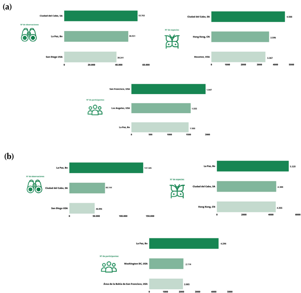
Figura 2. Posición de la región metropolitana de La Paz en el concurso City Nature Challenge: a) 2019 y b) 2022

En el concurso internacional CNC, las ciudades participan en tres categorías: 1) mayor número de observaciones, 2) mayor número de especies registradas y 3) mayor número de participantes. El 2019, la región metropolitana de La Paz, en su primer año de concurso, quedó entre los diez primeros lugares en las tres categorías del concurso (entre 159 ciudades). Ocupó el segundo lugar en número de observaciones, el tercer lugar en número de participantes y el octavo lugar en número de especies (Figura 2a). En 2022, lideró en las tres categorías, compitiendo con 445 ciudades. La cantidad de observaciones y participantes fue más del doble que el alcanzado por las urbes que ocupan los segundos lugares en ambas categorías, i.e. , Ciudad del Cabo y Washington respectivamente, superando por casi mil especies a la primera, que ocupó el segundo lugar en esa categoría (Figura 2b).