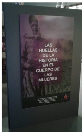
FIGURA 7. Panorámica de la exposición Las huellas de la historia en el cuerpo de las mujeres (Fotografías: María Marengo, 2018; fuente: colección de las autoras).