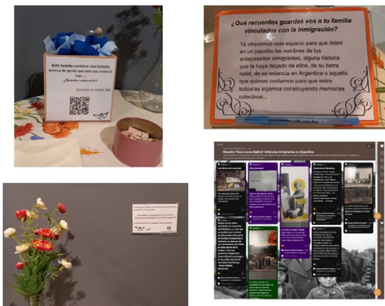
FIGURA 3. Algunas de las propuestas para la participación de las/los visitantes. Exposición Esos locos bajitos... Infancias inmigrantes en Argentina (finales del siglo XIX-mediados del siglo XX) (Fotografías: María Marengo, 2023; fuente: colección de las autoras).

tiempo y puedan involucrarse, intervenir o detenerse en aquellos aspectos que les produzcan mayor interés o atractivo. Asimismo, nos motiva generar emociones, sensaciones, vinculaciones afectivas y empáticas en las/los visitantes, así como conexión con sus historias y circunstancias, más allá de la adquisición o no de contenidos conceptuales. Por ello, en las exposiciones se han establecido sectores para la participación de los públicos (Figura 3). Adicionalmente, creamos material pedagógico para el personal de recepción y las y los guías del Museo, y sugerimos que las instituciones educativas realicen actividades didácticas.