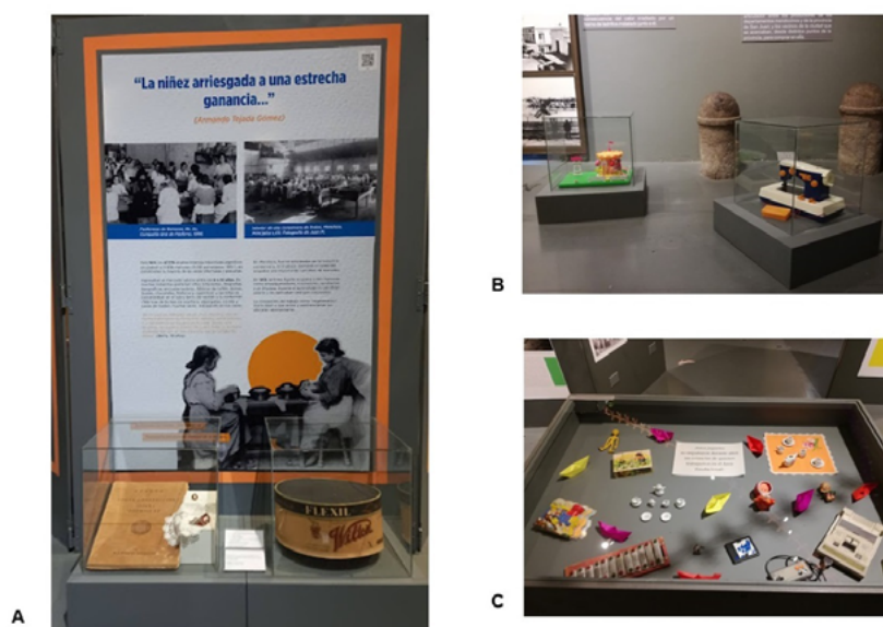
FIGURA 10. A) Panorámica general de la exposición Infancias. Postales de la vida de niños y niñas en tiempos modernos (finales del siglo XIX-principios siglo XX) ; B) Sector temático “La muerte de un niño”; C) Vista del panel de inicio de la exposición Infancias. Postales de la vida de niños y niñas en tiempos modernos (finales del siglo XIX-principios siglo XX) (Fotografías: María Marengo, 2019; fuente: colección de las autoras).

A) Panel con imágenes y código QR con enlaces de audio; B) y C) Vitrinas accesibles (Fotografías: María Marengo, 2019-2023; fuente: colección de las autoras).