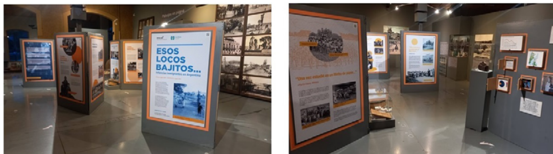
FIGURA 11. Panorámicas de la exposición Esos locos bajitos... Infancias inmigrantes en Argentina (finales del siglo XIX-mediados del siglo XX) (Fotografías: María Marengo, 2023; fuente: colección de las autoras).

perteneciente a un empleado del ferrocarril “Buenos Aires al Pacífico”, con objetos de papelería e instrumental ferroviarios, en la voz de una de sus nietas, quien recuperaba la historia de su abuelo y de su esposa inmigrante.