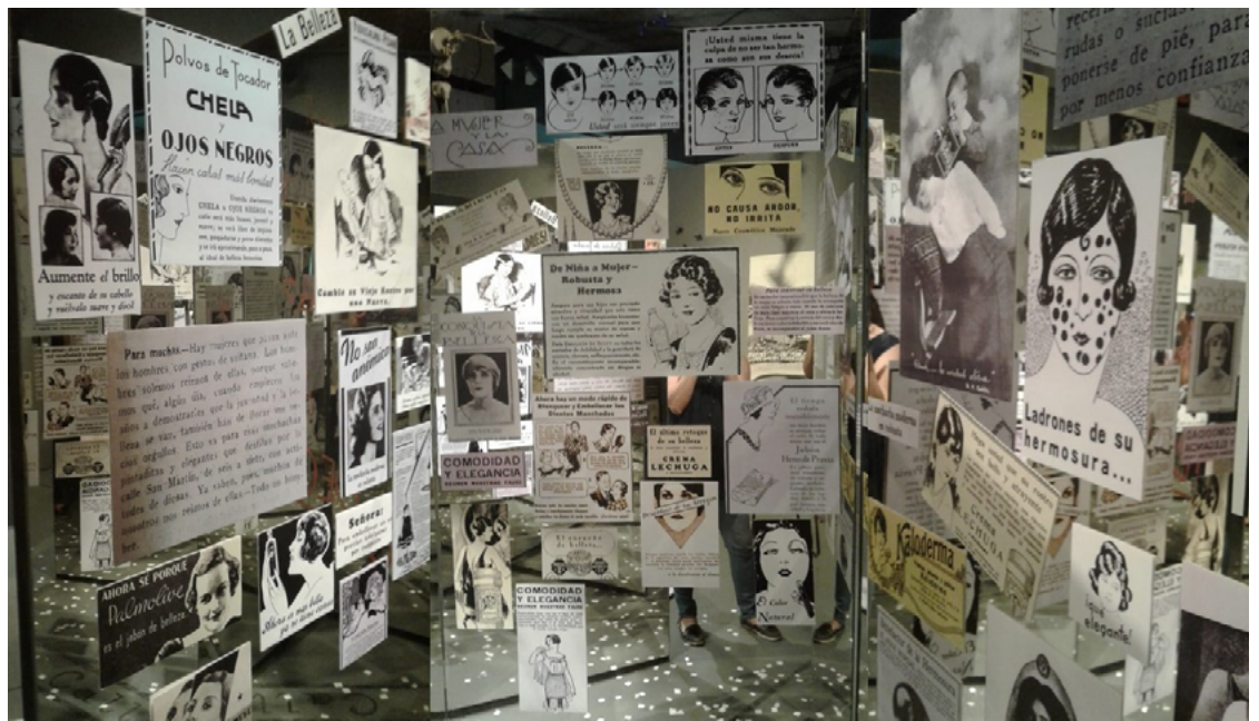
FIGURA 8. Detalles de la instalación ¿Te mirás? ¿Te gustás? Exposición Las huellas de la historia en el cuerpo de las mujeres.

Esta construcción se realizó a partir del abordaje de imágenes, fotografías y revistas, y también de materiales históricos y arqueológicos. En ese sentido, fue muy importante el abordaje de libros escolares publicados en ese periodo.