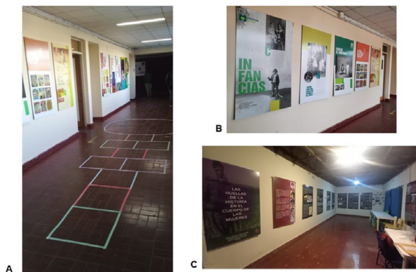
FIGURA 5. Itinerancia de las exposiciones por instituciones educativas públicas de la provincia de Mendoza. A y B). Exposición Infancias. Postales de la vida de niños y niñas en tiempos modernos (finales del siglo XIX-principios del siglo XX) en el IES Vera Peñalosa, departamento de San Carlos (2022); C) Exposición Las huellas de la historia en el cuerpo de las mujeres , en CEBJA 3062, departamento de Tupungato (año 2022) (Fotografías: 2022; fuente: colección de las autoras).

Como ya mencionamos dentro de la propuesta metodológica, tiene gran relevancia el ofrecimiento de la exposición a distintos organismos e instituciones de la provincia, principalmente, instituciones educativas de formación docente, alejadas geográficamente del centro de Mendoza y con problemáticas socioeconómicas afines a las temáticas trabajadas 7 (Figura 5).