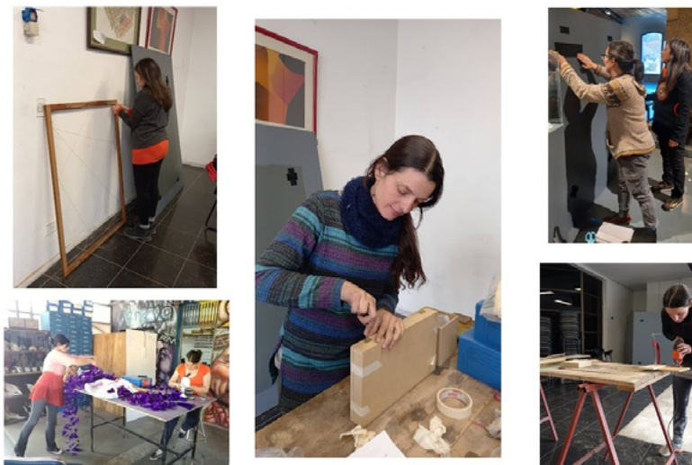
FIGURA 1. Distintas etapas de trabajo.