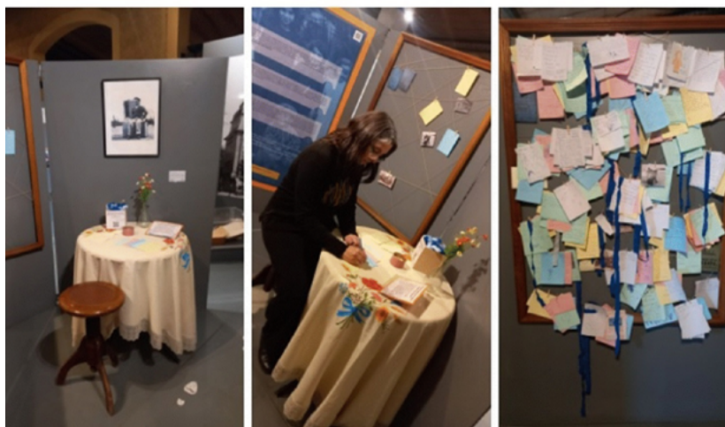
FIGURA 13. Escenas de la actividad de cierre de la exposición Esos locos bajitos... Infancias inmigrantes en Argentina (finales del siglo XIX-mediados del siglo XX) (Fotografías: María Marengo, 2023; fuente: colección de las autoras).

FIGURA 12. Una propuesta para la participación del público. Exposición Esos locos bajitos... Infancias inmigrantes en Argentina (finales del siglo XIX-mediados del siglo XX) . (Fotografías: María Marengo, 2023; fuente: colección de las autoras).