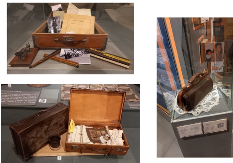
FIGURA 2. Objetos musealizados y sus historias. Exposición Esos locos bajitos... Infancias inmigrantes en Argentina (finales del siglo XIX-mediados del siglo XX) (Fotografías: María Marengo, 2023; fuente: colección de las autoras).

También seleccionamos la sala y diseñamos la propuesta museográfica en el espacio, considerando el orden de las cédulas, los soportes museográficos, los recorridos previstos y las actividades interactivas. Es importante agregar que alentamos un recorrido autónomo, con el objetivo de que las y los visitantes lo hagan a su