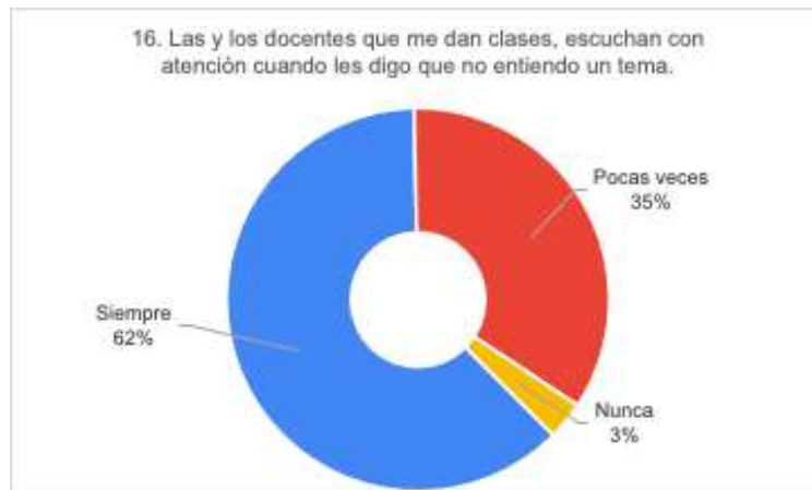
Gráfico 2. Categoría 1. Comunicación asertiva

necesidades del estudiantado, también dejan al descubierto la necesidad de fomentar conversaciones constructivas entre ambas partes, a fin de incentivar el aprendizaje.