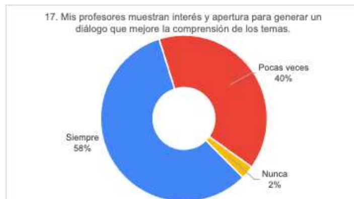
Gráfico 3. Categoría 1. Comunicación asertiva

La propuesta desde el coaching educativo es que el o la docente sea capaz de fomentar respuestas y recursos en el estudiantado. Se trata de una labor que busca ayudar y promover aptitudes y competencias en el desarrollo académico universitario (Villa, 2008 citado en Valero, 2019). De allí que la comunicación asertiva, como herramienta del coaching, puede ser “el fundamento del sistema educativo el cual a su vez puede promover el desarrollo de la criticidad de los aprendices, quienes, al experimentar un diálogo excelso con sus maestros, pueden fortalecer su personalidad y fomentar hábitos de proactividad que confluyan hacia la autonomía educativa” (Martínez, 2018, p.92).