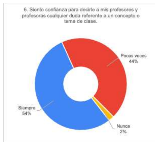
Gráfico 5. Categoría 3. Bienestar emocional

Dentro de la categoría tres, relacionada con el bienestar emocional se preguntó si el alumnado siente confianza para externar con sus profesores y profesoras las dudas relacionadas con un tema de clase. Poco más de la mitad contestó que siempre la experimentan (ver gráfico 5). Este dato resalta un trabajo que la mayoría de los y las docentes realiza para generar entornos confiables que fomenten claridad en los temas y por lo tanto una mejora en el aprendizaje.