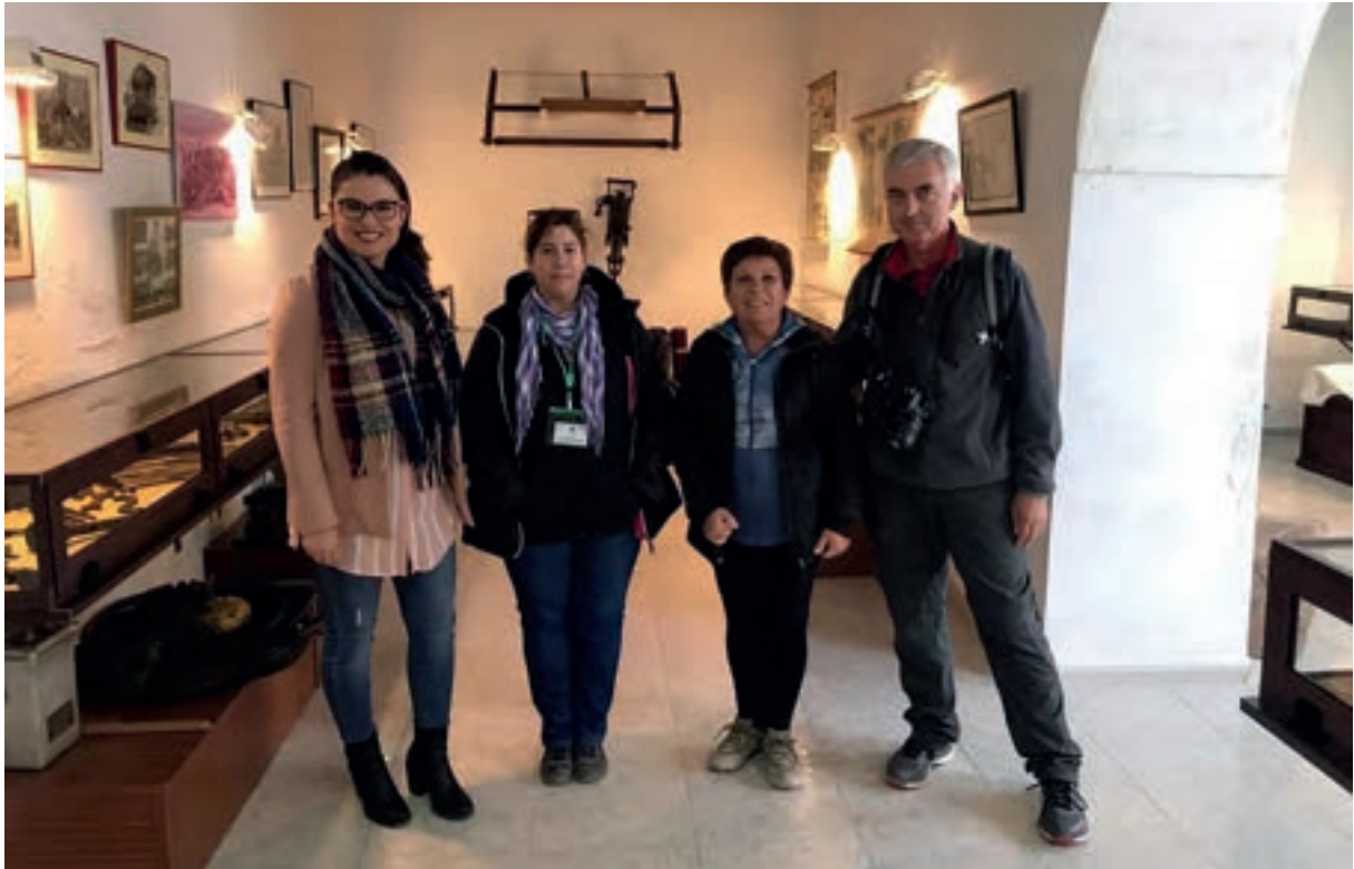
CLUB PATRIMONIO: Visita al Museo Histórico de Belmez y del Territorio Minero