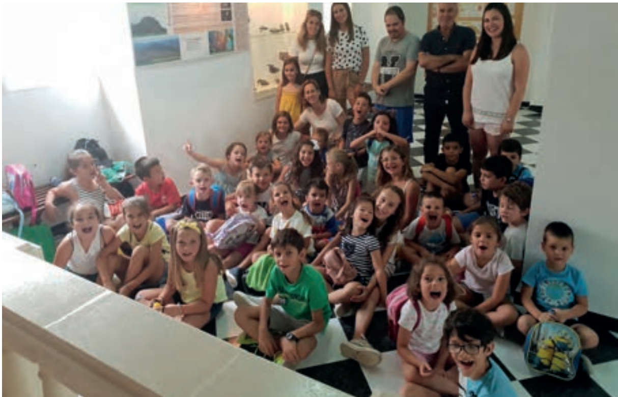
ESCUELA DE VERANO: Visita al Museo Histórico de Belmez y del Territorio Minero