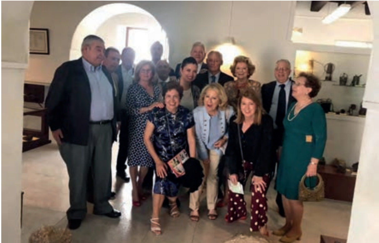
SEGUNDA PROMOCIÓN DE INGENIEROS TÉCNICOS DE MINAS: Visita al Museo Histórico de Belmez y del Territorio Minero