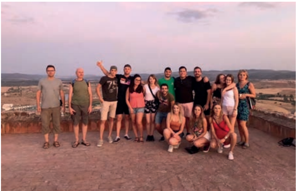
PARTICIPANTES DEL PROYECTO VIPSKILLS: Visita al Castillo