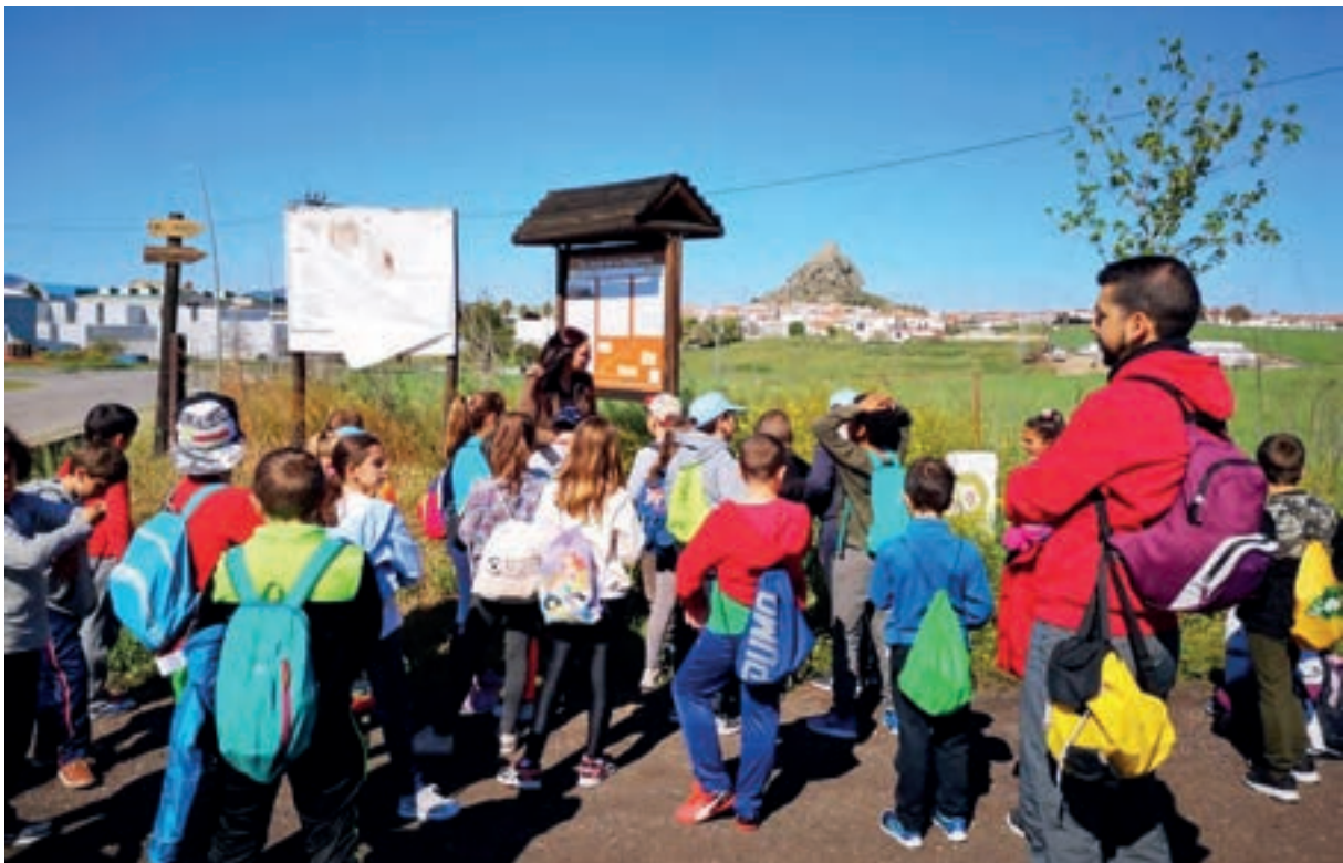
COLEGIO NTRA. SRA. DE LOS REMEDIOS: Visita a la Vía Verde “La Maquinilla”