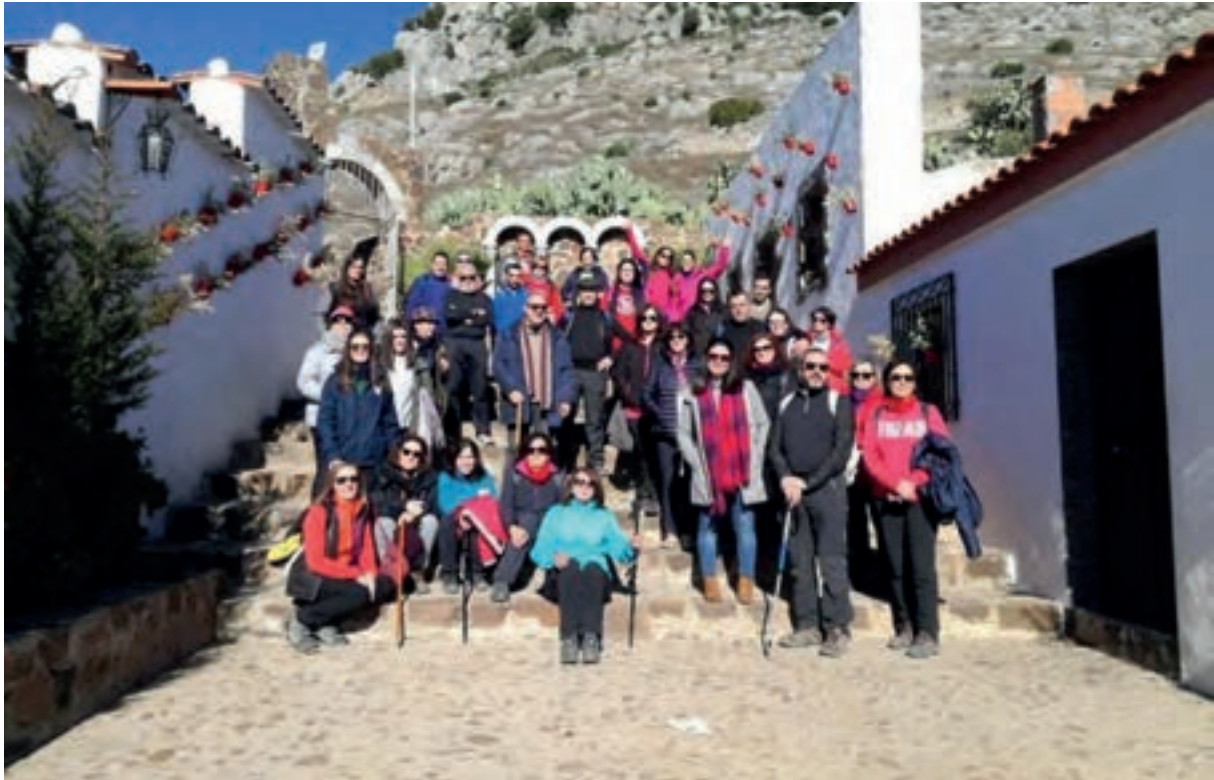
ASOCIACIÓN “ENTRE HINOJOS” : Visita al Castillo

A continuación, exponemos algunas imágenes de algunos de estos grupos.