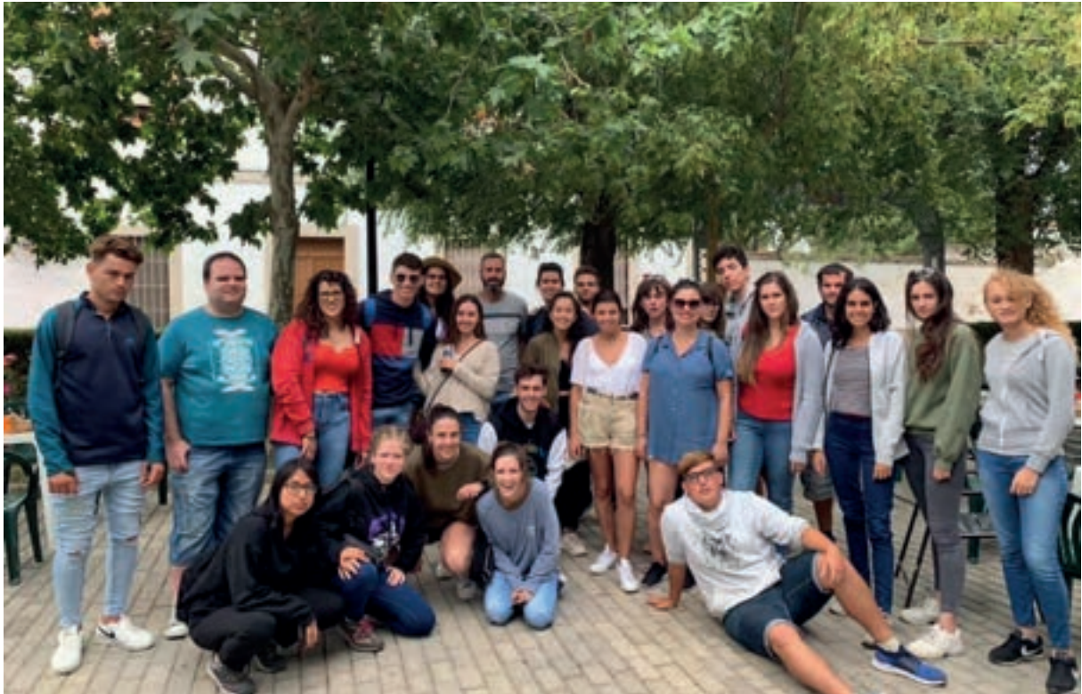
CAMPO DE VOLUNTARIADO JUVENIL “CAMINANDO BAJO LAS ESTRELLAS”: Visita al entorno natural de la Plaza del Santo