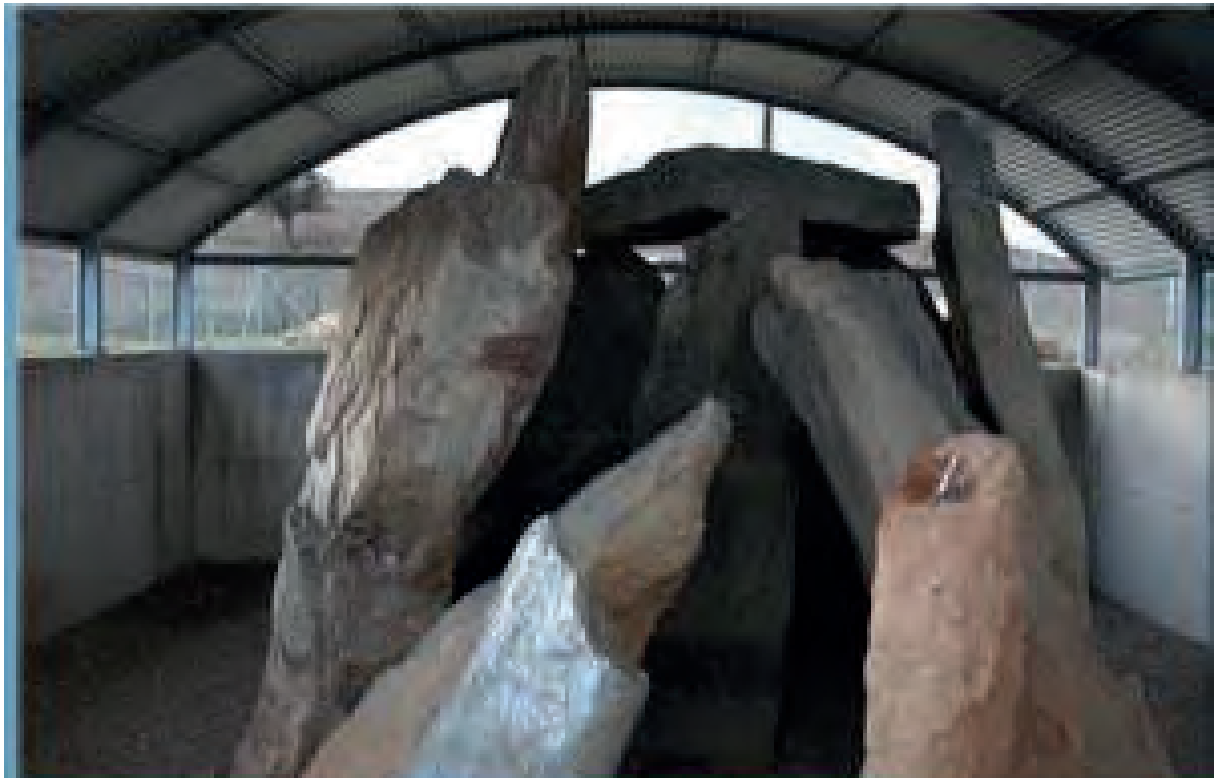
Dolmen "Casas de Don Pedro"