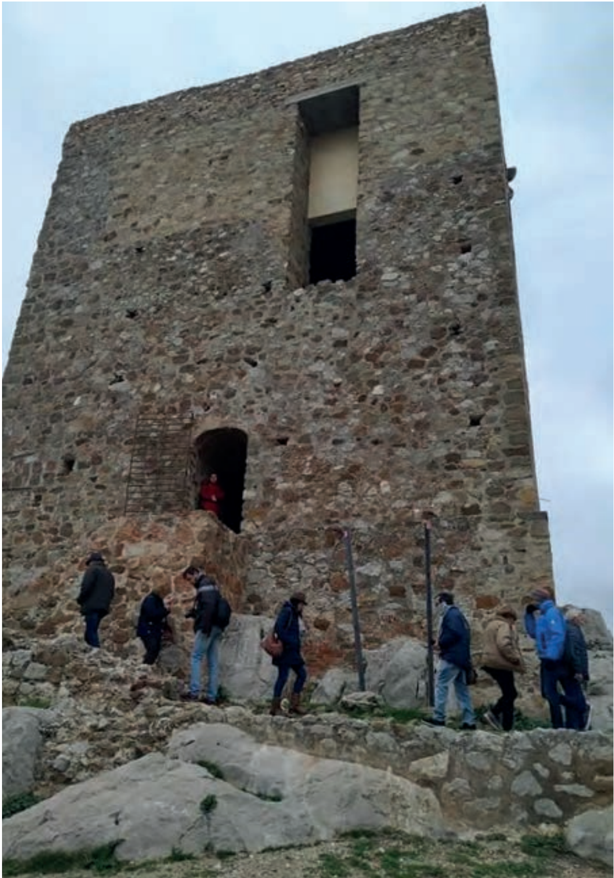
PARTICIPANTES EN LAS JORNADAS MEDIEVALES DE AGUILAR: Visita al Castillo