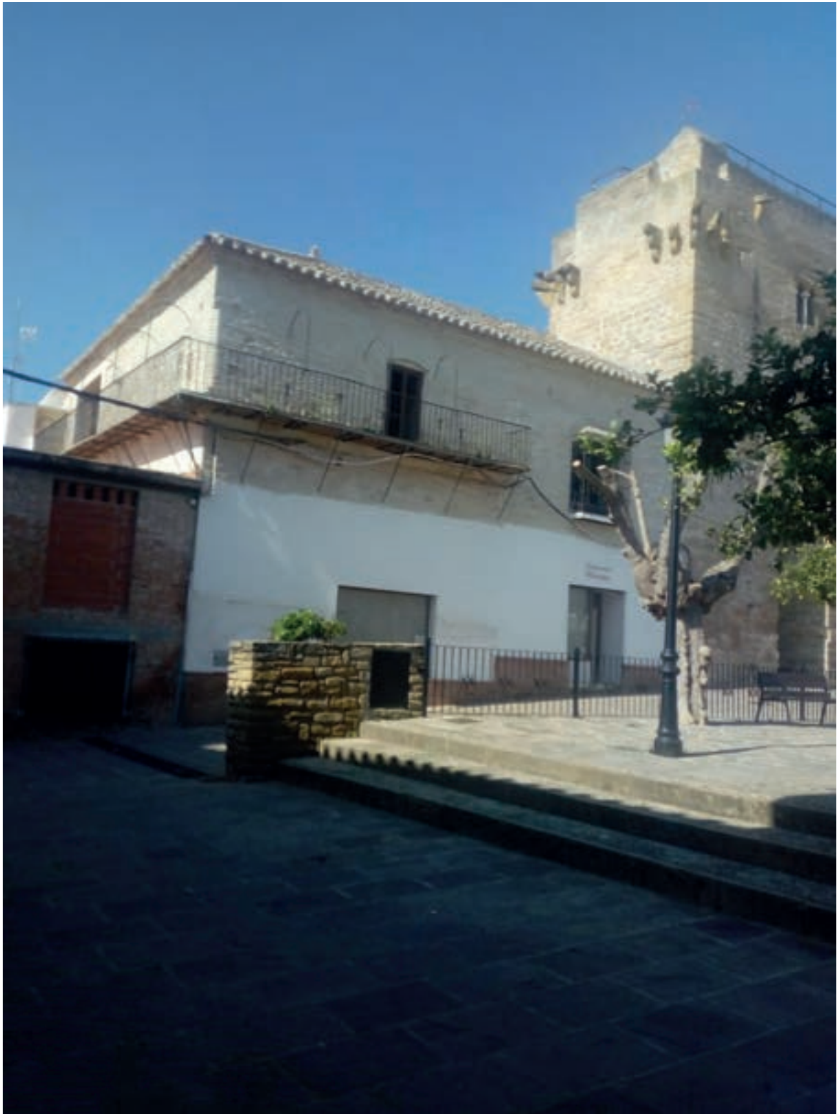
FOTO 3: Fachada de la parte sur del castillo medieval que corresponde a la parte de vivienda de los antiguos señores donde se trasladará el Museo Histórico.