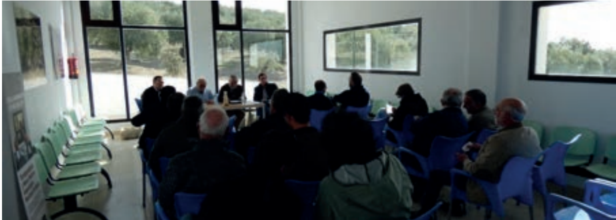
Asamblea de la Asociación Provincial de Museos Locales de Córdoba, en Baena.