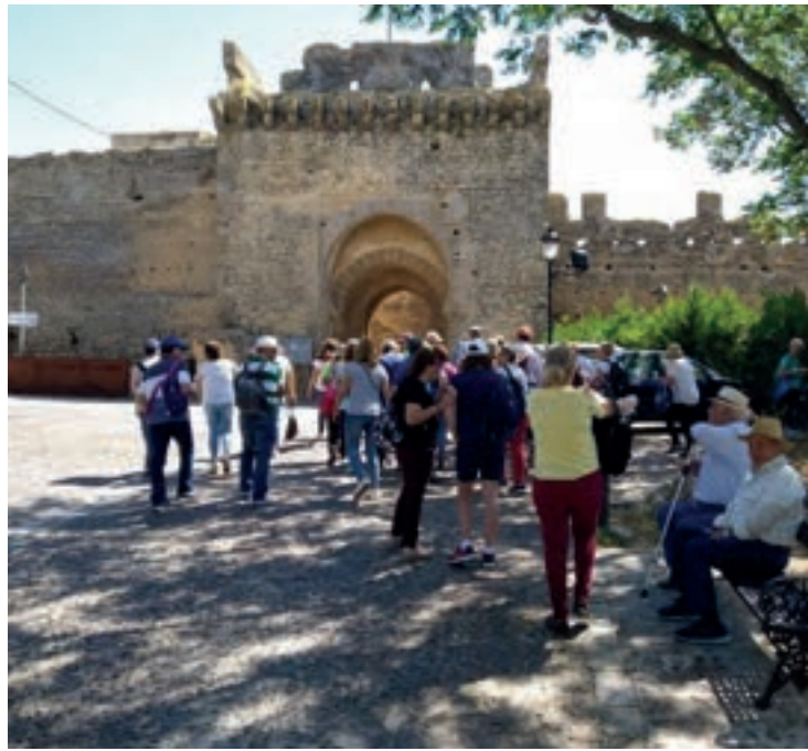
Cartel y participantes de “Conoce la historia caminado”, en Carmona.