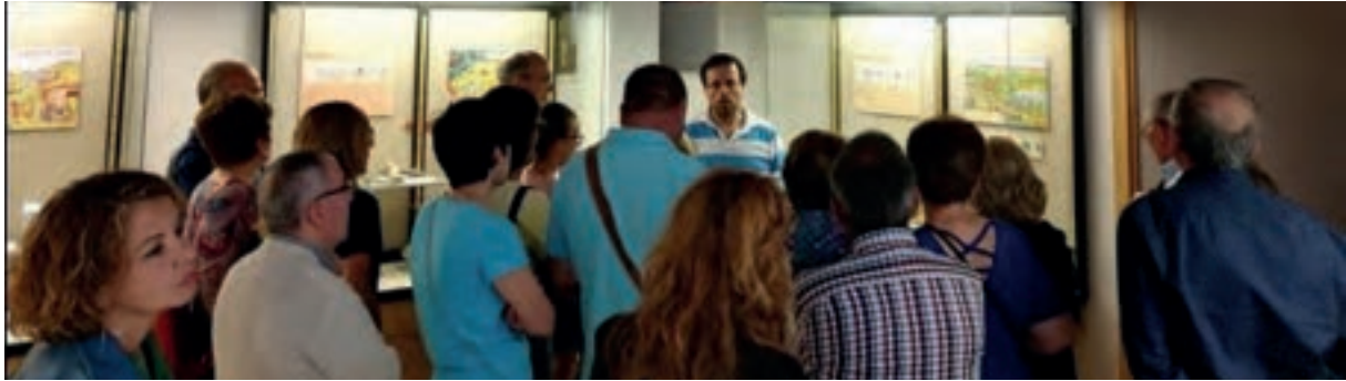
Cartel del Día Internacional de los Museos y participantes de la visita guiada.