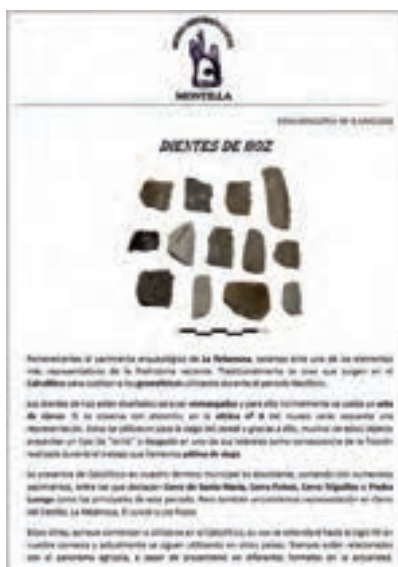
Fichas explicativas nº 8 y 9 sobre dientes de hoz neolíticos y Ceres.

4. El Museo también ha vuelto a elaborar fichas explicativas de piezas y materiales singulares, las cuales se encuentran disponibles al público tanto en formato físico como en digital.