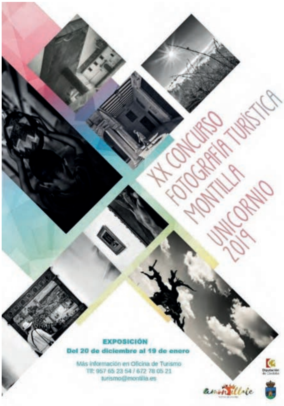
Cartel del XX Concurso de Fotografía Turística de Montilla Unicornio.