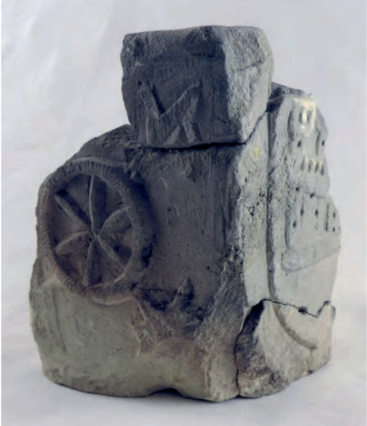
La denominada “lámpara del castillo”