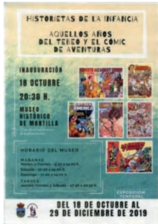
Carteles de las exposiciones temporales “El noticiero y su máquina de escribir” e “Historias de la infancia. Aquellos años del tebeo y el cómic de aventuras”.

3. Así mismo, gracias a la desinteresada colaboración de amigos del patrimonio local, se pusieron en marcha tres exposiciones temporales: “Siguiendo el rastro de la ballena de Montilla”, que expone el hallazgo del primer cetáceo fósil de España; “El noticiero y su máquina de escribir”, en el que se hace un recorrido por la prensa a través de la historia; e “Historias de la infancia. Aquellos años del tebeo