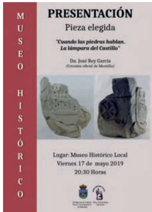
Carteles de la presentación de la pieza elegida.