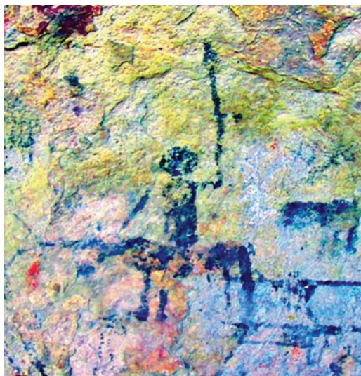
Figura 12. Motivo de jinete con lanza; imagen tratada digitalmente con D-Stretch