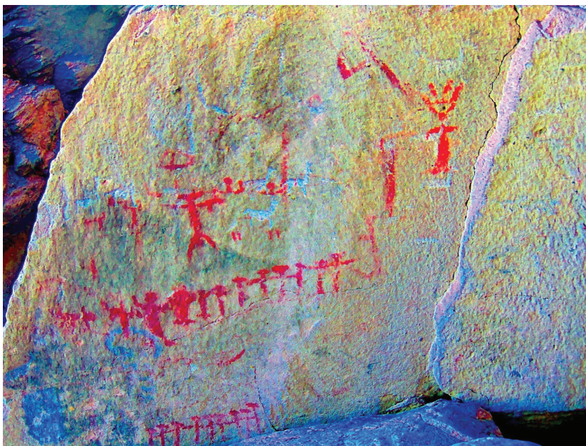
Figura 4. Representaciones antropomorfas, periodo Formativo; se observa superposición de figuras de camélidos con diseño característico del Tardío; imagen tratada digitalmente mediante D-Stretch

Dentro de los figurativos, la tendencia de un predominio de lo antropomorfo ha sido reconocida también para las modalidades estilísticas formativas en ANS (Aschero, 1999), lo cual refuerza temáticamente la adscripción cronológica tentativa que proponemos para estas representaciones de Huaicohuasi.