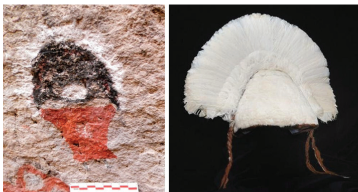
Figura 11. Antropomorfo con unku y casquete de HH, y casquete con plumas de la Doncella de Llullaillaco (imagen tomada de Velárdez Fresia, 2018, p. 238)

En términos estrictamente icónicos, la semejanza es mayor con este que con los cascos de Pica 8. Esta comparación abre la posibilidad de que la ejecución de estos motivos se haya producido en tiempos del contacto con los inkas o ya bajo el dominio imperial del NOA.