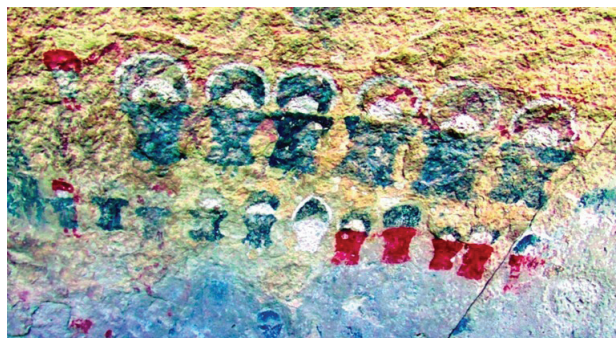
Figura 9. Personajes con unkus y casquetes; imagen tratada digitalmente con D-Stretch

El color que predomina es el negro (en menor medida rojo) con algunos detalles en blanco como, por ejemplo, el borde del gorro/casquete, la cabeza y algunos diseños internos en la vestimenta. El registro de superposiciones entre estos personajes y los escutiformes, es el principal argumento para ubicarlos dentro de un momento final del periodo Tardío o principios del Inka (figura 10).