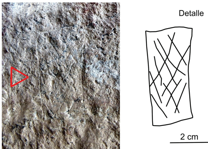
Figura 3. Motivo de cartucho de HH con diseño interno reticulado oblicuo

Cronológicamente, para el Periodo Formativo, las representaciones comprenden grabados y pinturas, teniendo los primeros una frecuencia mucho menor que los pintados. Entre los grabados prevalecen los motivos no figurativos: surcos aislados, geométricos irregulares, puntiformes y un motivo rectangular con diseños geométricos internos o cartucho ( sensu Aschero et al. , 2006) (figura 3).