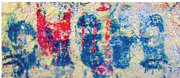
Figura 10. Superposición de unkus sobre escutiforme; imagen tratada digitalmente con D-Stretch

personajes de Huaicohuasi estén portando un casquete con plumas similar al que fue registrado en el contexto funerario inka del Llullaillaco y que pertenecía al ajuar que acompañaba a uno de los cuerpos: la Doncella (Velárdez Fresia, 2018) (figura 11).