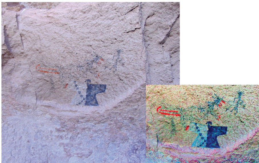
Figura 6. Escena de enfrentamiento entre felino y antropomorfo, y representación tardía de antropomorfo T; imagen de detalle tratada digitalmente con D-Stretch

Para el Periodo Medio, una de las características del repertorio iconográfico es la figura del felino, ya sea representado como tal o desde sus atributos principales (manchas del pelaje, fauces, garras, cola larga y enroscada, etc.). Se destaca un motivo compuesto por un felino y un antropomorfo donde el primero parece estar acechando/atacando al segundo, configurando una escena de enfrentamiento (figura 6). El antropomorfo se representó también de forma dinámica, con cuerpo y cabeza en norma frontal, pero piernas y pies orientados hacia la izquierda en dirección al felino. Otros atributos del antropomorfo son un adorno cefálico radiado (¿plumas?), y un arco y flecha apuntando hacia el animal.