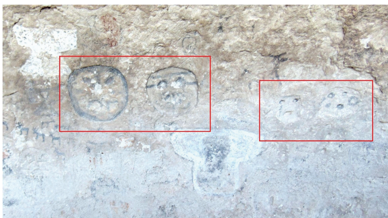
Figura 5. Representaciones de rostros/mascariformes pictograbados de HH

También se han identificado un grupo de motivos que comprenden la representación de dos pares de rostros/mascariformes pictograbados que, por el momento, preferimos asociar a este lapso a partir de argumentos de base comparativa: primero, que la representación de rostros humanos o mascariformes conforma uno de los temas rupestres característicos del Formativo del NOA (Aschero, 1996, 1999, Martel, 2004) y, segundo, que la ocurrencia de a pares ha sido registrada también en la quebrada de Miriguaca, en ANS (Martel y Escola, 2011), lo cual establece otro nuevo posible vínculo entre las poblaciones a uno y otro lado del área internodal del volcán Galán (figura 5).