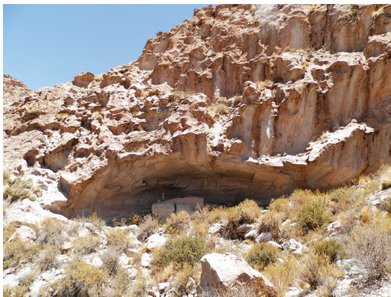
Figura 2. Vista general del alero Huaicohuasi

El alero se localiza en la base de un farallón ignimbrítico, a unos 30 m de altura respecto del fondo de la quebrada. Presenta un área de reparo amplia, de aproximadamente 160 m 2 , definida por una boca de 40 m de ancho y una profundidad promedio de 4 m desde la línea de goteo, con una altura máxima aproximada de 4 m en el sector central. Las representaciones rupestres se distribuyen a lo largo de casi la totalidad de la pared del alero. Grandes bloques rocosos desprendidos del techo forman parte del sitio y presentan numerosos morteros en sus caras horizontales, grabados y pinturas rupestres en el resto de sus caras. Pese a su gran dimensión, Huaicohuasi presenta características de visibilidad y visibilización restringidas dada la circunscripción espacial de su emplazamiento, lo cual determina también cierta dificultad en su acceso (figura 2).