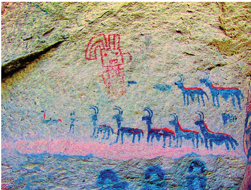
Figura 7. Figura antropomorfa con rasgos felínicos y motivo de caravana; imagen tratada digitalmente con D-Stretch

(p.e. representación de las cuatro patas) sugieren una adscripción pretardía (para más información sobre la variabilidad cronológica de los diseños, ver Aschero, 1996, 1999 y Martel, 2010).