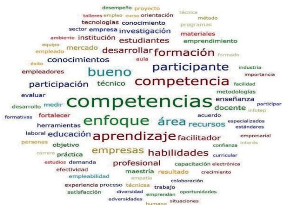
Figura 2. Nube de palabras del grupo focal docente Infotep