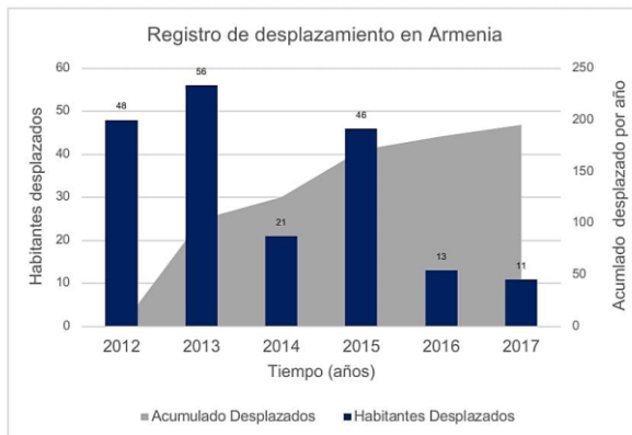
Figura 2. Elaboración propia basada en Alcaldía Municipal de Armenia-Antioquia, (2019).

Por ejemplo, 48 personas fueron registradas para el 2012, 56 para el 2013, 21 para el 2014, 46 para el 2015, 13 para el 2016, y 11 para el 2017 (Alcaldía Municipal de Armenia-Antioquia: 2019, p. 77). En la figura 2, se puede ver el comportamiento en términos de desplazamiento forzado del 2012 al 2017 en el municipio de Armenia.