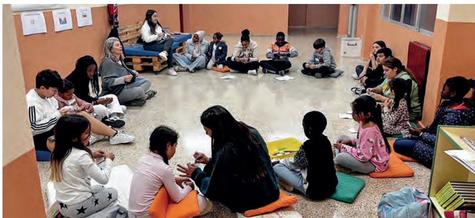
Imatge 5. Reunió del Consell de la Infància i l'Adolescència.

A partir de juny de 2023, s'ha creat el Consell de la Infància i l'Adolescència de Naüm. Com ja s'ha explicat, durant la fase de sensibilització i reflexió, cada grup de NNA ha anat treballant dins el context de les activitats educatives i lúdiques de Centre de Dia, en assemblees i cercles de diàleg la definició sobre bons tractes i sobre riscos i maltractaments percebuts pels NNA en el seu entorn comunitari. Arran d'aquesta anàlisi, els grups han iniciat un procés, també en assemblees, de generació i valoració d'idees, iniciatives i propostes per donar-hi resposta. A partir de la figura del delegat del Consell de cada grup, càrrec rotatiu i assignat aleatòriament, la infància ha presentat a la direcció del centre les propostes elaborades. En les reunions del Consell de la Infància de Naüm, la direcció del centre ha debatut, amb els delegats d'infància i adolescència, cada una de les propostes, unificant les propostes semblants de diversos grups i ordenant per prioritats de cada grup de NNA.