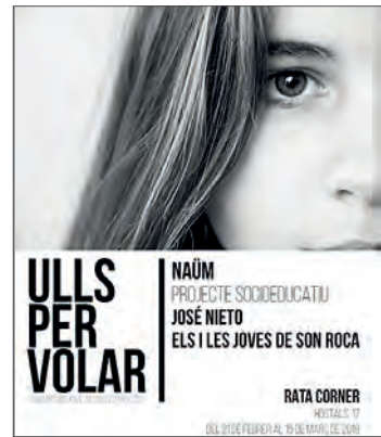
Imatge 3. Cartell de l'exposició fotogràfica «Ulls per volar; una mirada jove als bons tractes», duta a terme per l'adolescència i joventut participant de Naüm.

D'aquesta manera, el nostre coneixement, el dels i de les professionals del centre Naüm, ha estat construït de manera col·laborativa i socialment compartida. Han estat aquestes interaccions, amb les persones participants i el seu entorn social, les que han generat significats i comprensions compartides sobre què són els bons tractes i què és l'acompanyament respectuós a la infància i l'adolescència. A partir de la interacció, el diàleg, la col·laboració i l'intercanvi d'idees amb les persones menors hem après quines són les condicions adequades perquè es doni l'aprenentatge, quins entorns són els que els NNA senten com a segurs i en els quals poden desenvolupar les seves capacitats. La infància i l'adolescència participant, així com les seves famílies, per a nosaltres són un òrgan consultiu, acomplint, així, una doble funció: per una banda, posar en pràctica el dret dels NNA a expressar les opinions i a participar en