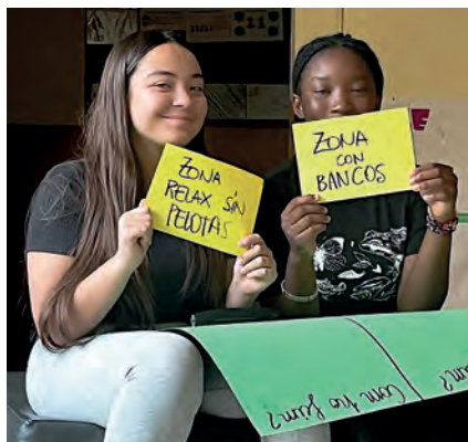
Imatge 7. Adolescents prioritzant projectes proposats.