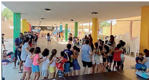
Imatge 1. Activitats del Centre de Dia a l'Escola d'Estiu 2023, Naüm Son Roca.

El centre Naüm es va crear a Son Ximelis, l'any 2000, amb l'objectiu de fer activitats formatives i lúdiques amb un grup reduït de joves. Sempre hem treballat amb la metodologia de medi obert i treball socioeducatiu comunitari. Durant aquests vint-i-quatre anys d'intervenció, hem anat establint vincles amb la comunitat, hem detectat necessitats i potencials en les persones i col·lectius, i hem dissenyat programes, projectes i serveis per fomentar els factors de protecció comunitaris, de grup, familiars i individuals i, així, disminuir la influència dels factors de risc presents als territoris on actuem.