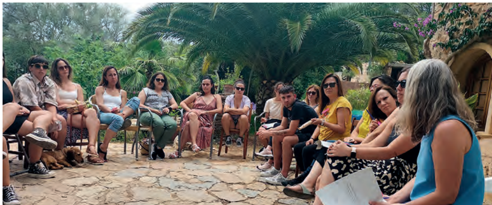
Imatge 2. Equip de treballadors i treballadores de Naüm, formant-nos en els principis de la Llei orgànica 8/2021.

menors, les seves famílies i la comunitat, perquè aquests subjectes siguin el motor de l'evolució del centre Naüm, del seu propi procés socioeducatiu i de la comunitat.