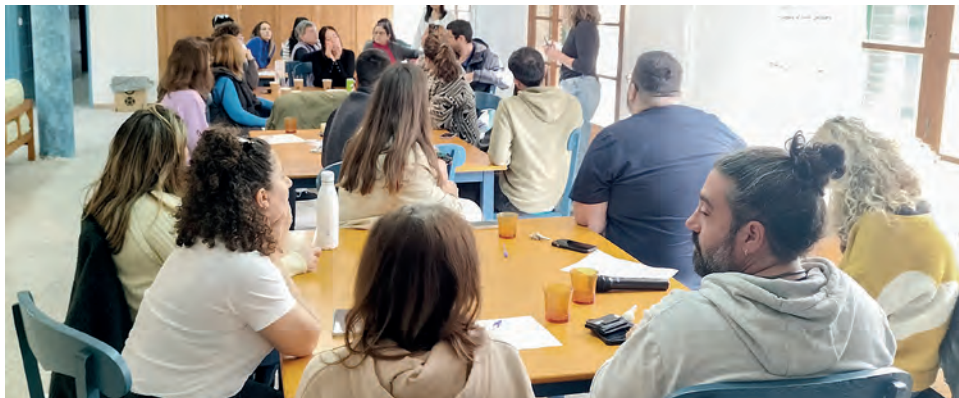
Imatge 4. Equip de treballadors i treballadores de Naüm, creant les comissions de feina.

A partir de juny de 2023, s'ha creat el Consell de la Infància i l'Adolescència de Naüm. Com ja s'ha explicat, durant la fase de sensibilització i reflexió, cada grup de NNA ha anat treballant dins el context de les activitats educatives i lúdiques de Centre de Dia, en assemblees i cercles de diàleg la definició sobre bons tractes i sobre riscos i maltractaments percebuts pels NNA en el seu entorn comunitari. Arran d'aquesta anàlisi, els grups han iniciat un procés, també en assemblees, de generació i valoració d'idees, iniciatives i propostes per donar-hi resposta. A partir de la figura del delegat del Consell de cada grup, càrrec rotatiu i assignat aleatòriament, la infància ha presentat a la direcció del centre les propostes elaborades. En les reunions del Consell de la Infància de Naüm, la direcció del centre ha debatut, amb els delegats d'infància i adolescència, cada una de les propostes, unificant les propostes semblants de diversos grups i ordenant per prioritats de cada grup de NNA.