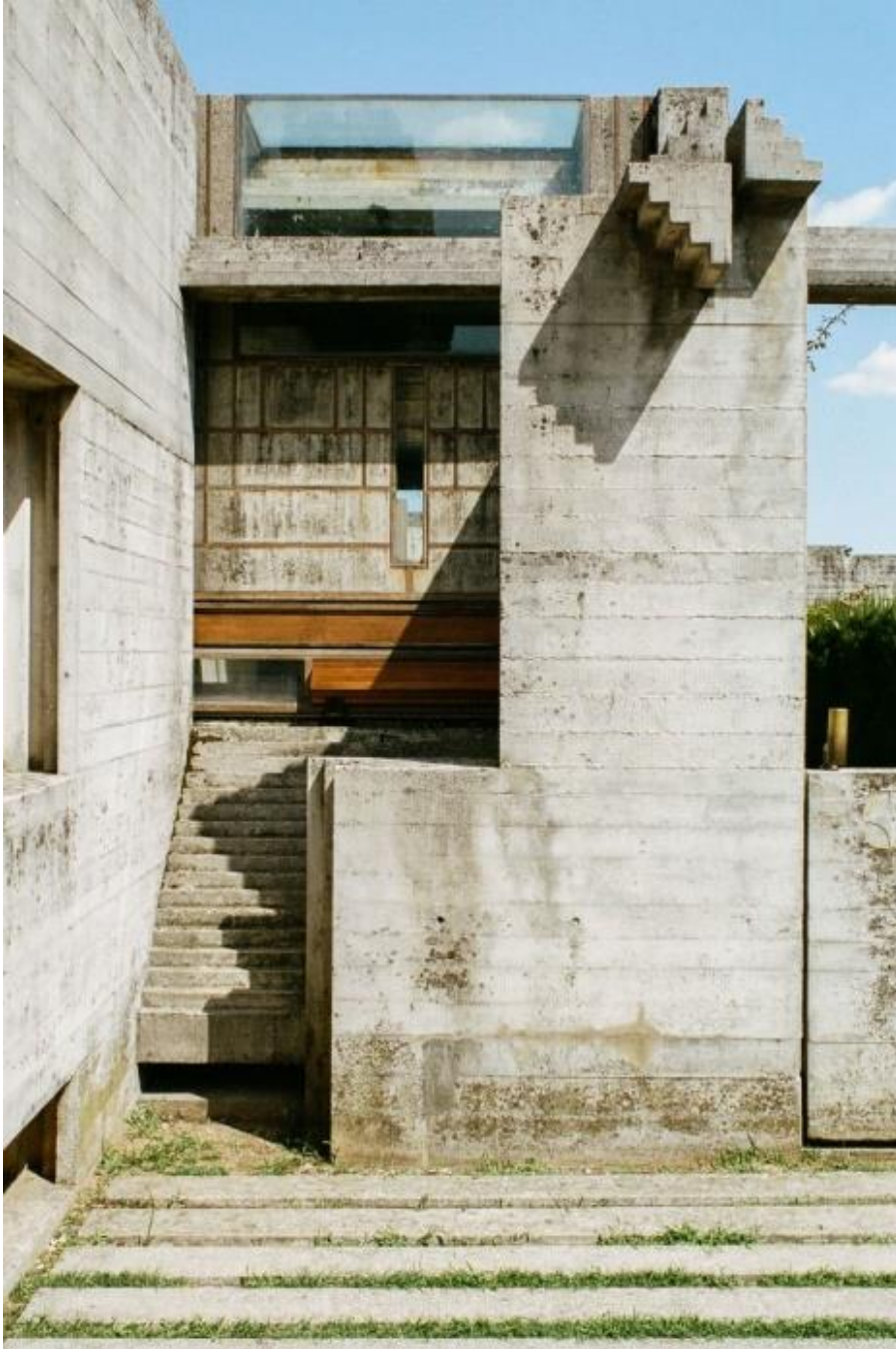
Figura 1. Riqueza de detalles. San Vito d'Altivole, Italia. 1969-78. Carlo Scarpa.