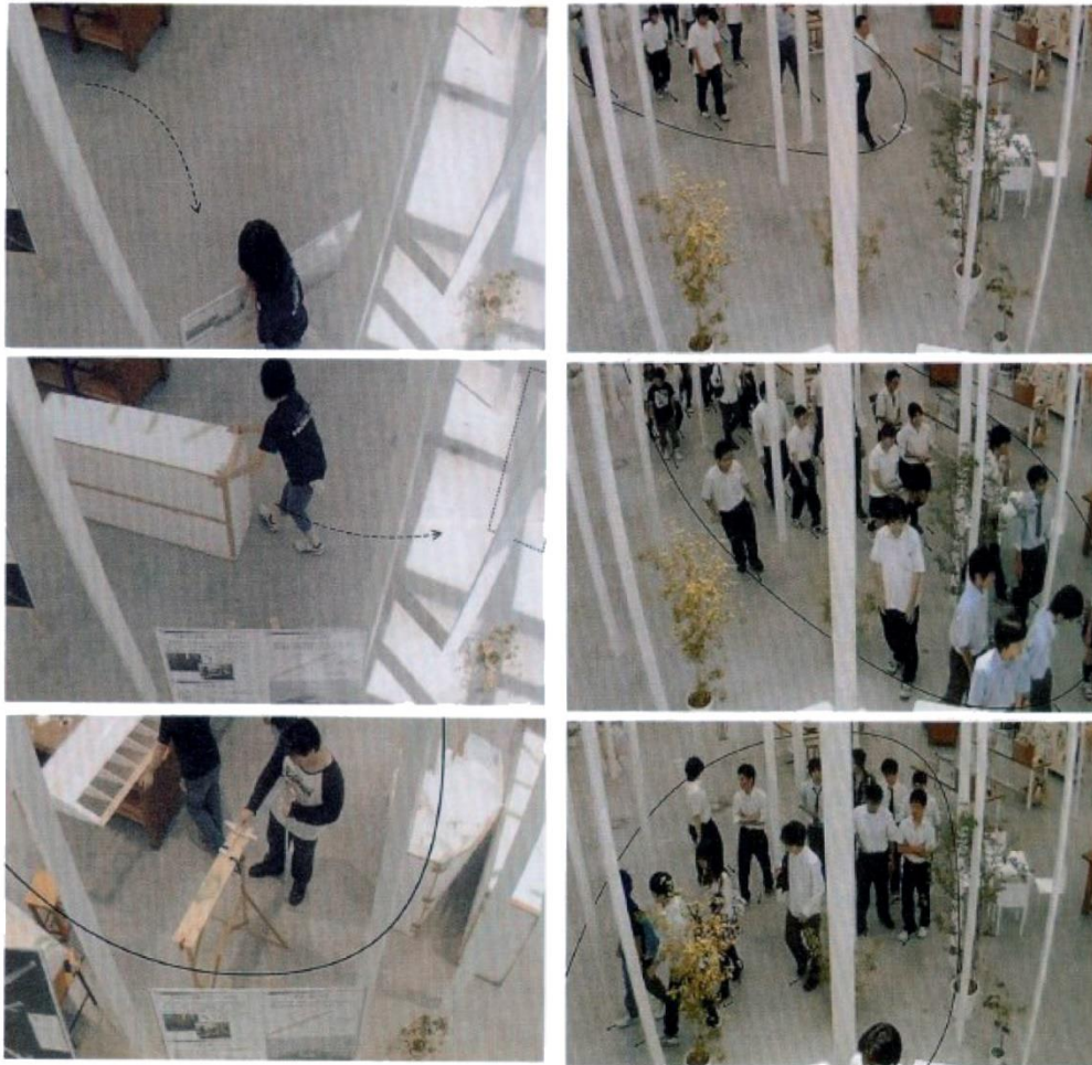
Figura 5. Cámaras colocadas para estudiar el comportamiento de las personas en el espacio del Workshop

Al interior el tiempo más que sucederse linealmente se entiende en un desenvolvimiento espiral, en lo orgánico, multidimensional y heterogéneo. El contraste escalar, entre el gran espacio total del edificio y el mínimo espacio personal del equipamiento, sólo puede explicarse a través de la correlación variable de sus diferentes estados, una especie de “intimidad de lo redondo” diría Bachelard. Para Ishigami se plantea aquí una relación diferente que en la arquitectura, donde se puede notar que ciertos elementos están para cumplir una función; por el contrario, busca una racionalidad que puede ser menos sobre una simple correspondencia lineal de función y forma, y más sobre la vinculación de nuevas relaciones en medio de una complejidad inconmensurable e infinita (Ishigami, 2011, p. 57). En contraste con lo anterior, la forma desde el exterior es fácilmente aprehensible e inmutable (salvo por la escena que refleja en sus vidrios. Figura 4 a); la figura geoméricamente definida, rigurosa y cerrada del contenedor, niega cualquier referencia vertical y profundiza la fuga horizontal (Figura 4 b). Allí, aparentemente no hay nada que explorar, parece que todo está dado por supuesto y expone ciertos determinismos: los canales del perímetro mecanizan un movimiento lineal y homogéneo, la rigidez formal hace pensar en un tiempo-espacio lógico y rigurosamente dispuesto.