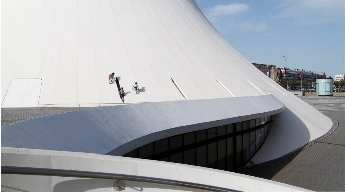
Figura 2. El juego como exploración corporal. Le Volcan de Oscar Niemeyer en El Havre, Francia.