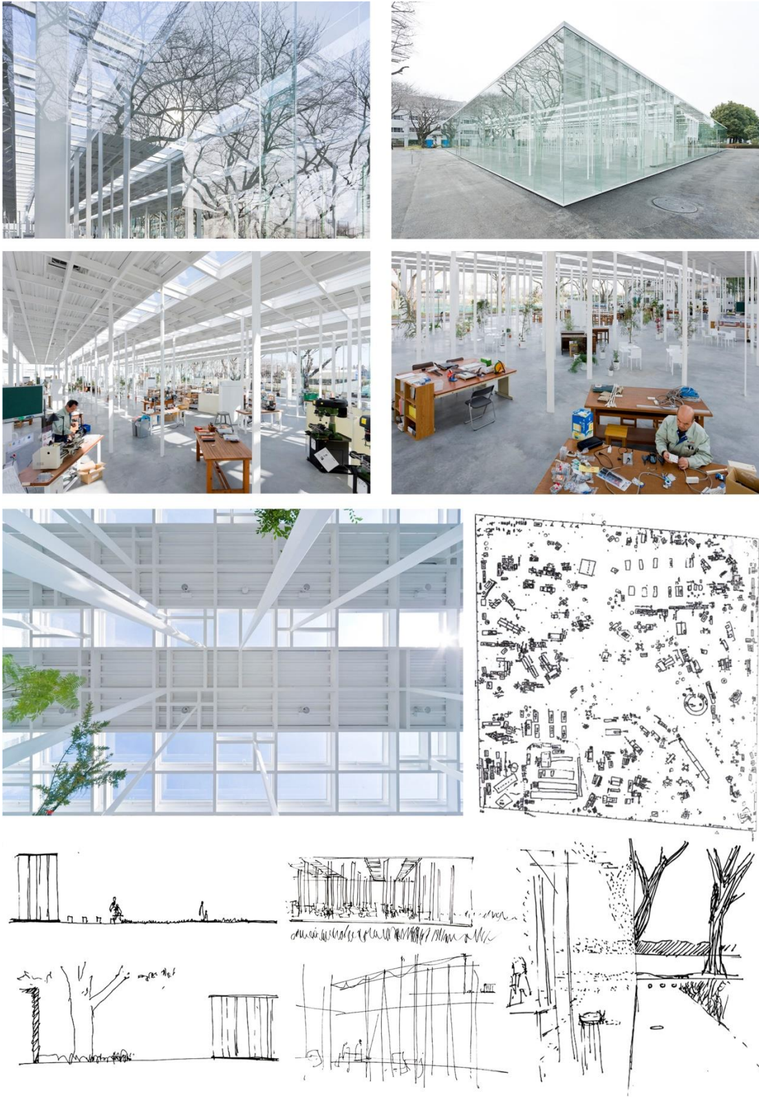
Figura 4. a, b, c, d y e. Fotografías del exterior e interior del Workshop. f. Diagrama de reconocimiento 15/07/2010 (Ishigami, 2011. Pág. 58). g. Dibujos y esquemas realizados a partir de videos en Internet.