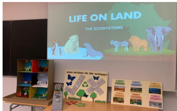
Ilustración 4: Ejemplo UD ODS 15 Vida de ecosistemas terrestres