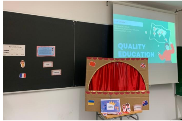
Ilustración 3: Ejemplo UD ODS 4 Educación de Calidad