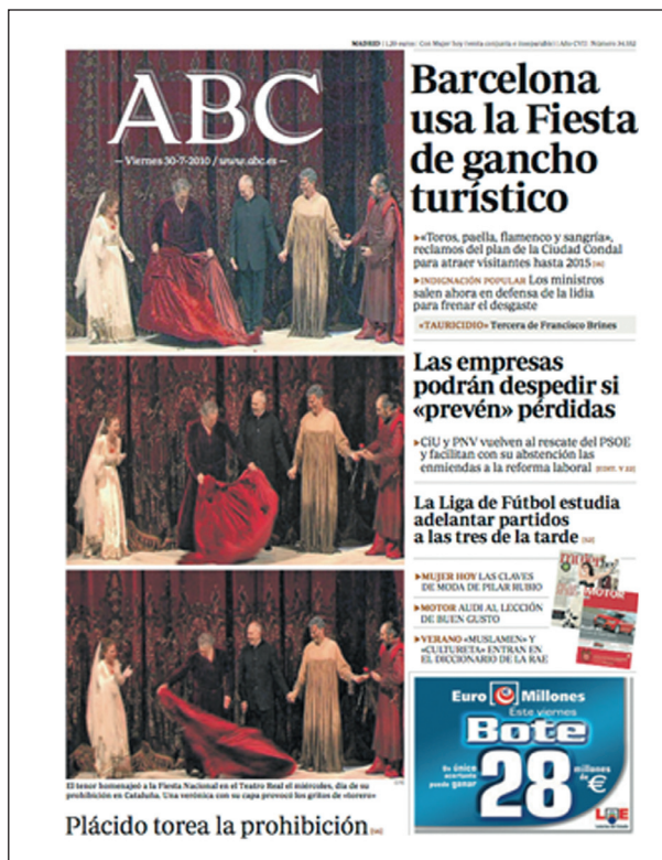
Figura 5 ABC, 30-VII-2010

la portada del periódico de Vocento recoge en una secuencia fotográfica el gesto del tenor Plácido Domingo al emular a un torero con la capa de su atuendo, al término de su actuación en el escenario del Teatro Real el 28 de julio (fig. 5). Al día siguiente, el periódico fundado por Luca de Tena