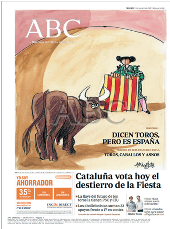
Figura 2 ABC, 28-VII-2010

editorial: «Dicen toros, pero es España» y de «La Tercera», rubricada ese día por Luis Francisco Esplá 36 . Además, el principal titular informativo resalta que «Cataluña vota hoy el destierro de la fiesta» al tiempo que la portada del diario de Vocento recoge también las declaraciones de los toreros Enrique Ponce y Julián López «El Juli» quienes inciden en que: «Este ataque suena a dictadura» y «Usan los toros para atacar España» (fig. 2). Del editorial citado hemos querido resaltar los siguientes párrafos: