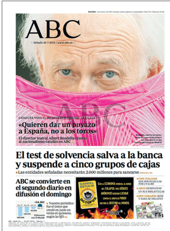
Figura 1 ABC, 24-VII-2010

elementos, entre ellos una fuerte carga de desafío del nacionalismo radical. Habrá que seguir con atención los próximos trámites parlamentarios de esta desafortunada proposición de ley [...]» 29 .