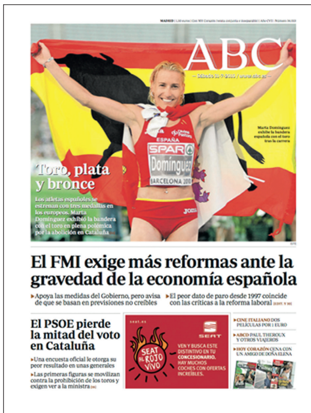
Figura 6 ABC, 31-VII-2010

lar el cese de «la manipulación política de la Fiesta». En páginas interiores, el diario editorializa sobre la movilización de los aficionados ante la prohibición y alberga artículos de, entre otros, Gabriel Albiac, Eugenio Trías e Ignacio Camacho que condenan explícitamente la abolición. Ese mismo día, la portada de El Mundo abría a cuatro columnas con el titular «Clamor en las plazas de España por la libertad de ir a los toros». En páginas interiores del periódico, el editorial se hacía eco del manifiesto «por la libertad de ir a los toros» –léído por los aficionados en las plazas donde se habían celebrado festejos taurinos el día anterior– y numerosos artículos de opinión incidían en lo que calificaban de «atropello cultural», y «atentado histórico contra la cultura». Otra portada muy significativa es la del 11 de diciembre de ese mismo año cuando, con motivo de la concesión del Premio Nobel de Literatura a Mario Vargas Llosa, reconocido aficionado al mundo taurino, el periódico de Vocento dedica su primera plana a una fotografía del célebre escritor con una montera perteneciente al no menos