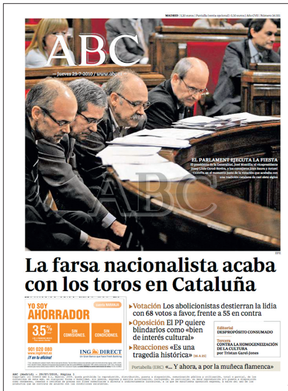
Figura 3 ABC , 29-VII-2010

Consumada la prohibición, al día siguiente, ambos periódicos llevan el tema a su primera plana. ABC señala que «La farsa nacionalista acaba con los toros en Cataluña» y recoge en su fotografía el momento en el que los líderes del PSC-PSOE, Esquerra Republicana de Catalunya y Convergència i Unió 40 se disponen a emitir su voto en el Parlamento (fig. 3). Por su parte,