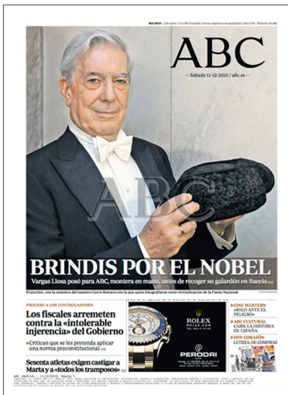
Figura 7 ABC, 11-XII-2010

célebre torero sevillano Curro Romero, para reivindicar una vez más la tauromaquia (fig. 7).