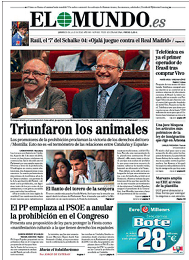
Figura 4 El Mundo , 29-VII-2010

El Mundo titula: «Triunfaron los animales» y elige una fotografía de los líderes de los dos primeros grupos políticos citados –José Montilla (PSC) y Josep Lluís Carod Rovira (ERC) –muy sonrientes (fig. 4).