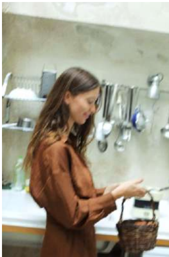
Fig. 10.- Fotografía página web de Zara.