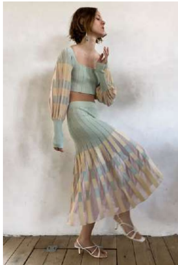
Fig. 12.- Fotografía página web de Zara.