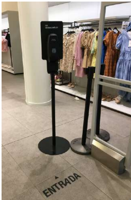
Fig. 8.- Fotografía entrada a Zara, Centro Comercial Ruta de la Plata (Cáceres, 2020).