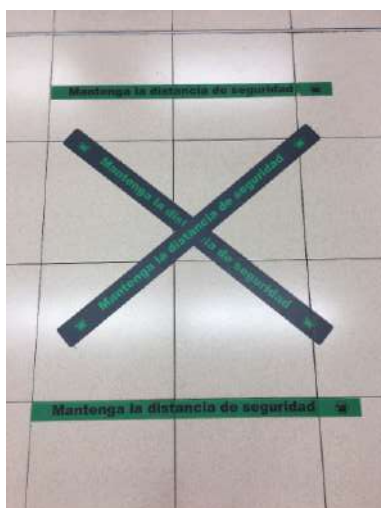
Fig. 5.- Fotografía línea de caja Mercadona (Cáceres, 2020).