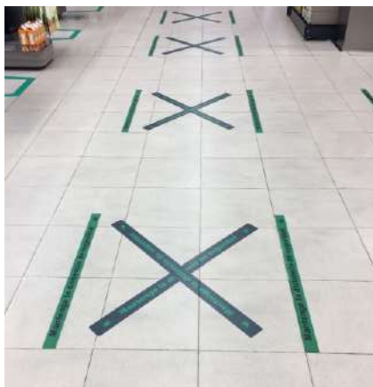
Fig. 6.- Fotografía línea de cajas Mercadona (Cáceres, 2020)..