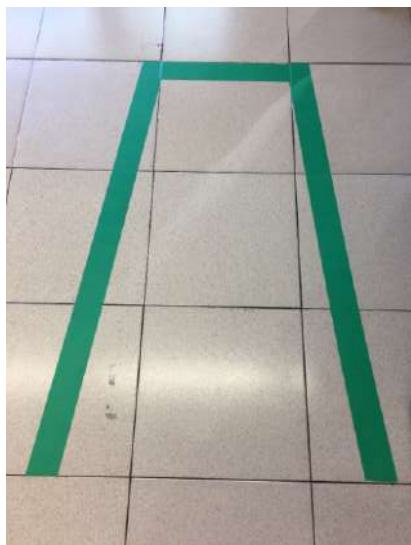
Fig. 7.- Fotografía para ubicar el carro al sacar la compra en Mercadona (Cáceres, 2020). (Fuente: Elaboración propia).