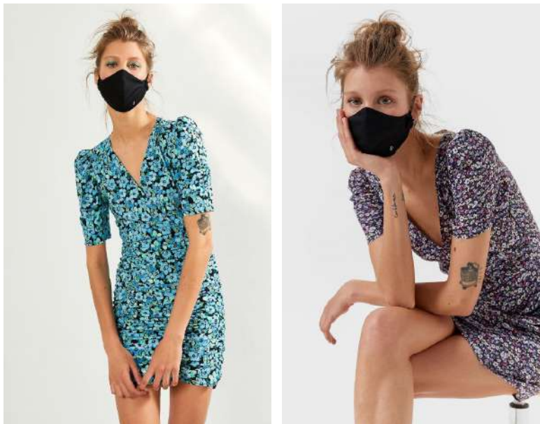
Fig. 13 y 14.- Fotografías página web de Stradivarius.