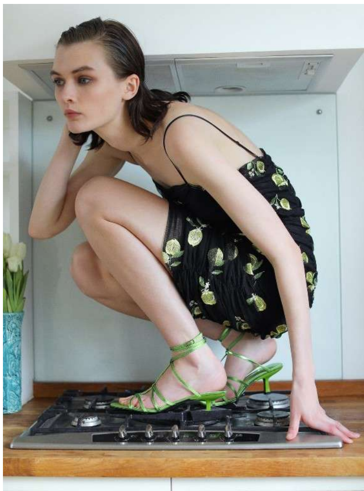
Fig. 9.- Fotografía página web de Zara.