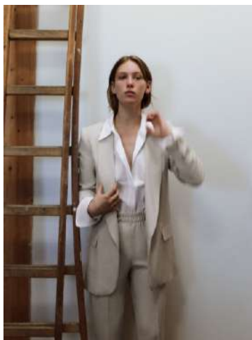
Fig. 11.- Fotografía página web de Zara.