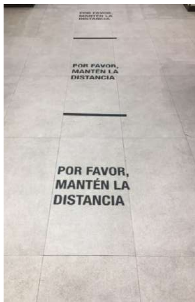
Fig. 4.- Fotografía suelo Zara, Centro Comercial Ruta de la Plata (Cáceres, 2020).