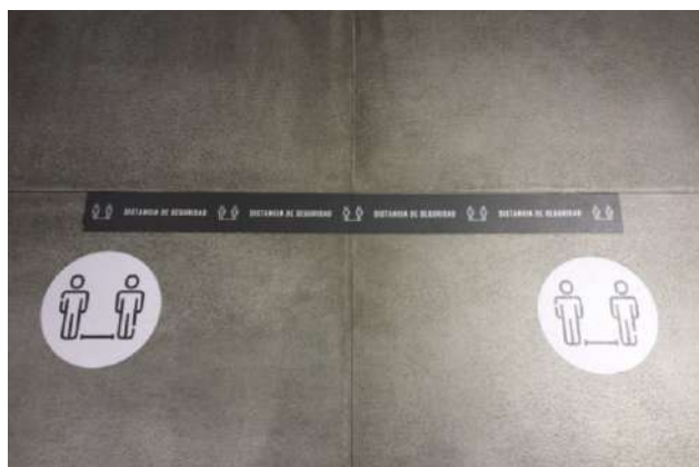
Fig. 3.- Fotografía suelo Springfield, Centro Comercial Ruta de la Plata (Cáceres, 2020).