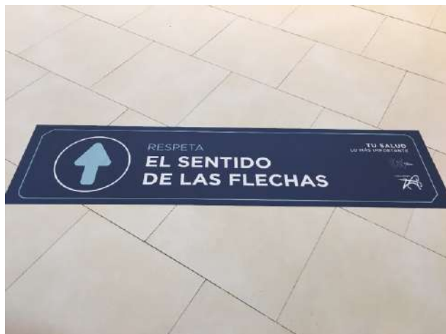
Fig. 2.- Fotografía suelo del pasillo Centro Comercial Ruta de la Plata (Cáceres, 2020).