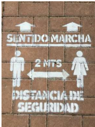
Fig. 1.- Fotografía de la acera en la calle indicando el sentido de la marcha y distancia de seguridad (Cáceres, 2020).

Y es en la llamada “nueva normalidad” cuando encontramos por las aceras figuras como esta, recordando el sentido de la marcha y la distancia de seguridad: