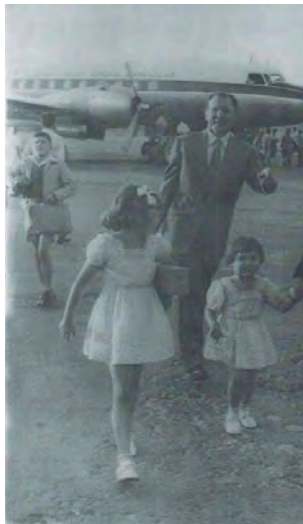
La España del exilio (AFAP).