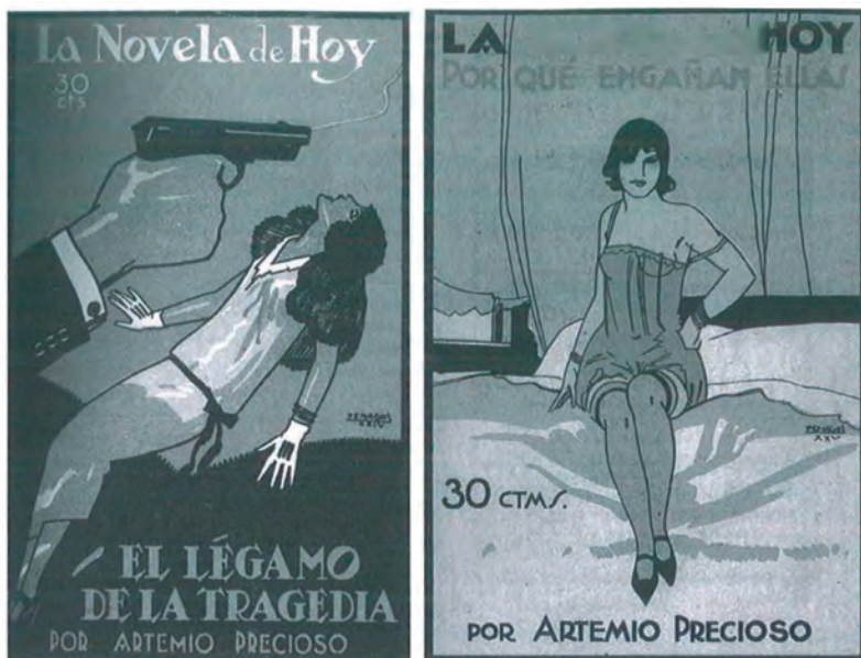
Portadas de novelas de Artemio Precioso García de los años veinte.

Con el aplastamiento de la República, su actividad democrática fue castigada por los nacionales. Fue detenido, y la petición fiscal de pena de muerte se resolvió finalmente con una condena a ocho años de prisión,