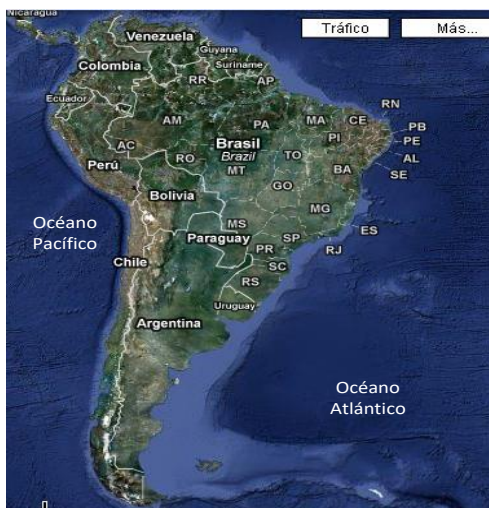
Figura 1: América del Sur.

Así mismo, los diez países de la región han realizado desde los 2003 avances significativos en los procesos de integración, entre los que destacan el acuerdo comercial entre la Comunidad Andina: Bolivia, Colombia, Ecuador, Perú y Venezuela, y el Mercosur: Argentina, Brasil, Paraguay y Uruguay, así como la ratificación para la creación de un área de libre comercio en el marco de la ALADI (Asociación Latinoamericana de Integración).