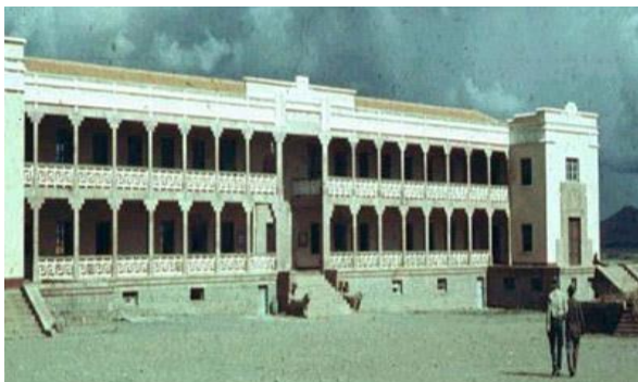
Escuela Warisata

Como se puede observar, eran principios de avanzada que buscaban el desarrollo de la comunidad que se incorporaron en los sistemas escolares de Guatemala, Perú, Ecuador y otros países de América Latina. En Bolivia actualmente la Escuela Superior de Formación de Maestros Warisata continúa practicando sus principios y tiene vigente la organización de aquellos años, lo que evidencia su vigencia.