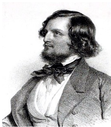
Ilustración 7. Giulio Briccialdi

tradición de la escritura para este tipo de formación en el Romanticismo. Merece especial atención el último de los mencionados: el italiano Guilio Briccialdi, compositor y virtuoso de la flauta (de hecho le apodaban el “paganini” de la flauta). Hizo una enorme contribución al desarrollo técnico del instrumento. Su música, como buen romántico, trata de expresar sentimientos, hace un uso intenso del cromatismo y en el plano armónico innova con relaciones hasta ahora inéditas. El desarrollo melódico es mucho más complejo y elaborado.