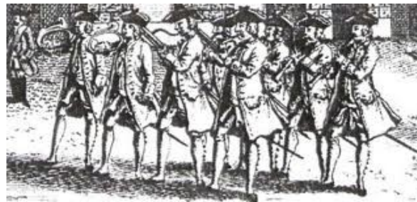
Ilustración 5. The British 1st Foot Guards Band, 1753