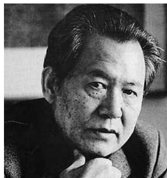
Ilustración 9. Isang Yun

A partir de aquí podíamos citar a muchos compositores, pero hemos creído conveniente quedarnos con los más relevantes bajo nuestro prisma. Ellos son Samuel Barber con su Summertime op. 31 compuesto en 1959, Jean Françaix nuevamente con su Quinteto de viento n.º 2 compuesto cuarenta años después del primero (1988) e Isang Yun con el Quinteto para vientos escrito en 1991 y sus características líneas múltiple-melódicas que él mismo bautizó como Haupttöne .