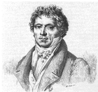
Ilustración 6. Anton Reicha

24 y 9 quintetos escritos respectivamente) los que la consolidaron como la formación camerística del Clasicismo. A cada uno se le atribuye sus propios méritos. De Danzi podemos destacar su pertenencia a la Orquesta de Mannheim y su obra operística, aunque pasó a la historia por su legado camerístico. Su carrera abarca los últimos años del Clasicismo y los primeros del Romanticismo. Es decir, conoció a Mozart en juventud y fue coetáneo de Beethoven. De Reicha, el que fue considerado durante mucho tiempo como el “inventor” de esta formación. Incluso afirmaba él mismo ser el primero en utilizarla. Hoy sabemos que no es así, pero lo que sí podemos atribuirle es el descubrimiento del potencial que esta formación encierra y el explorar sus posibilidades. Ambos consiguieron con su música elevar el Quinteto de viento a la categoría del Cuarteto de cuerda. La combinación de timbres, el sentido perfectamente concertante, un lirismo melódico extraordinario y una escritura con un alto grado de destreza hacen de sus composiciones un referente del periodo Clásico.