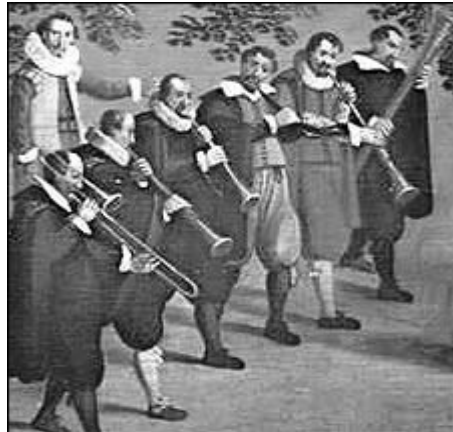
Ilustración 4. Alta Capella Sallaert, s. XVI

finalidad, pero una forma representativa podía ser la constituida por una chirimía, un bajón, un corneto, un sacabuche y dos bombardas.